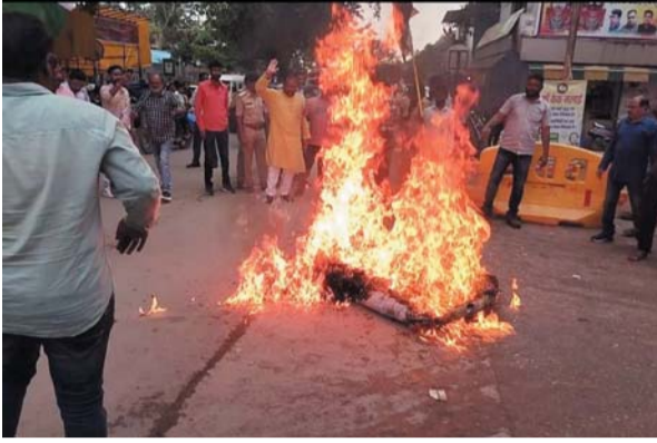
पायनियर संवाददाता < कांकेर www.dailypioneer.com