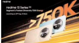
पायनियर संवाददाता < रायपुर www.dailypioneer.com

भारतीय युवाओं के सबसे लोकप्रिय ब्रांड, रियलमी ने अपनी नंबर सीरीज में रियलमी 13 सीरीज 5जी का लॉन्च किया है। यह स्मार्टफोन उद्योग में अब तक की सबसे तेज स्पीड प्रदान करेगा। इसमें डायमेंसिटी 7300 एनजी 5जी चिपसेट, 80 वॉट के अल्ट्रा चार्ज और 256जीबी डायनामिक रैम एक्सपेंसिव + 256जीबी रोम के साथ शक्तिशाली स्पीड का कॉम्बिनेशन है। रियलमी 13 सीरीज