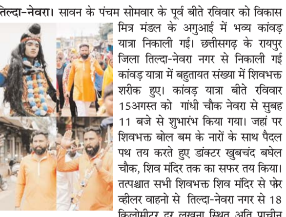
पायनियर संवाददाता < बलौदाबाजार www.dailypioneer.com

तिल्दा-नेवरा। सावन के पंचम सोमवार के पूर्व बीते रविवार को विकास मित्र मंडल के अगुआई में भव्य कावड़ यात्रा निकाली गई। छत्तीसगढ़ के रायपुर जिला तिल्दा-नेवरा नगर से निकाली गई कावड़ यात्रा में बहुतायत संख्या में शिवभक्त शरीक हुए। कावड़ यात्रा बीते रविवार 15 अगस्त को गांधी चौक नेवरा से सुबह 11 बजे से शूभारंभ किया गया। जहां पर शिवभक्त बोल बम के नारों के साथ पैदल पथ तय करते हुए डॉक्टर खुबचंद बघेल चौक, शिव मंदिर तक का सफर तय किया। तत्पश्चात सभी शिवभक्त शिव मंदिर से फेर व्हीलर वाहनों से तिल्दा-नेवरा नगर से 18 किलोमीटर दूर लखना स्थित अति प्राचीन