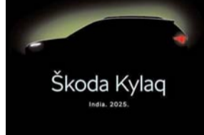
पायनियर संवाददाता < रायपुर www.dailypioneer.com

अब तक का सबसे बड़ा लॉन्च: स्कोडा ऑटो इंडिया ने एक नई कॉम्पैक्ट एसयूवी के नाम की घोषणा की है, जो इसके नेशनल 'नेम योर स्कोडा' कैम्पेन के जरिए नामित अपनी तरह की पहली एसयूवी है। राष्ट्रव्यापी भागीदारी: इस नामकरण अभियान के तहत 200,000 से अधिक प्रतिक्रिया प्राप्त हुईं, जिसके परिणामस्वरूप एक ऐसे नाम का चयन हुआ जो स्कोडा के पारंपरिक आईसीयू एसयूवी नामकरण के अनुरूप है और 'के' से शुरू होकर 'क' पर