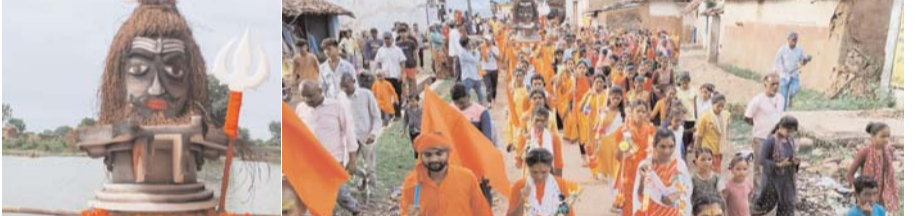
पायनियर संवाददाता < तिल्दा-नेवरा www.dailypioneer.com

सिमगा ब्लाँक के ग्राम पंचायत नवागाँव ने दिव्य तालाब के पास प्राचीन भगवान शिव मंदिर के पास से कांवरिया जल लेकर शिधि व्रत पूजा अर्चना कर कांवरिया ने बाजे गाजे व डीजे की धुन में नाचते गाते भोले भद्रही महामहोदय के जयकारा लगाते हुए गांव के मुख्य मुख्य मार्गों से होते हुए। भव्य रूप से शोभा यात्रा निकाली गई। कांवरियों का जल्था