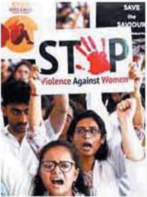
संघर्ष जटिल तथा लंबे समय से जारी है। यौन हिंसा, उत्पीड़न तथा कार्यस्थल पर भेदभाव बार-बार जनता के गुस्से का कारण बनते हैं। कानूनी सुधारों और जागरूकता अभियानों के बावजूद महिला-विरोधी हिंसा के मामले बहुत अधिक हैं। अस्पतालों समेत सार्वजनिक स्थल देखभाल के केन्द्र होने चाहिए, पर अनेक महिलाओं के लिए ये खतरनाक बन जाते हैं। इससे समस्या को 'व्यवस्थागत' प्रकृति सामने आती है। स्वास्थ्यरक्षा क्षेत्र खासतौर से चिन्ता का विषय है क्योंकि महिला डाक्टरों और नर्सों को न केवल मरीजों के परिवारों से हिंसा का सामना करना पड़ता है, बल्कि उनको सहयोगियों व बरिष्ठों से यौन उत्पीड़न जैसी आंतरिक समस्याओं से भी जूझना पड़ता है। इस दुहरे खतरे के कारण उनका पेशेवर जीवन लगातार चुनौतीपूर्ण व असुरक्षित बन जाता है। सर्वोच्च न्यायालय द्वारा मामले में हस्तक्षेप से उम्मीद पैदा होती है कि इसके बाद अस्पतालों तथा सार्वजनिक संस्थानों के लिए प्रभावी सुरक्षा प्रोटोकाल तैयार होंगे। सुप्रीम कोर्ट द्वारा कोलकाता मामले को जांच के बाद उम्मीद की जाती है कि इससे भारत में महिला-सुरक्षा के प्रति समग्र दृष्टिकोण अपनाया जाएगा। इस मामले में केवल डाक्टरों पर ध्यान केन्द्रित करने के बजाय महिलाओं को कार्यस्थलों, यात्रा और जीवन में हिंसा और भेदभाव के भय से मुक्ति दिलाने के तरीके खोजे जाने चाहिए। अदालत का फैसला महिलाओं के प्रति जोखिम वाले दूसरे पेशों के लिए भी लाभदायक होगा।