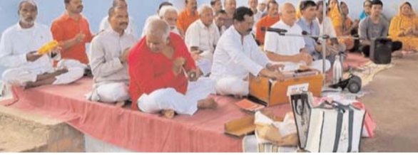
पायनियर संवाददाता < महासमुंद www.dailypioneer.com