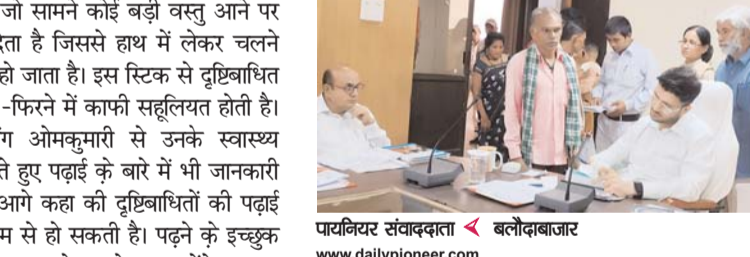
पायनियर संवाददाता < बलौदाबाजार www.dailypioneer.com