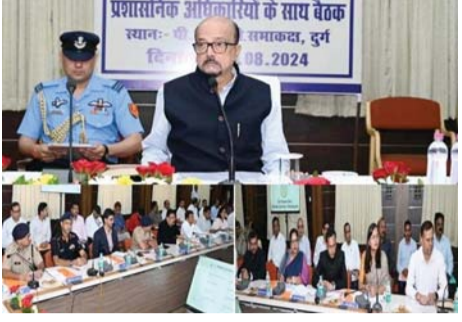
पायनियर संवाददाता < रायपुर www.dailypioneer.com

राज्यपाल ने पर्यावरण संवर्धन हेतु सभी से एक पेड़ लगाने का किया आह्वान