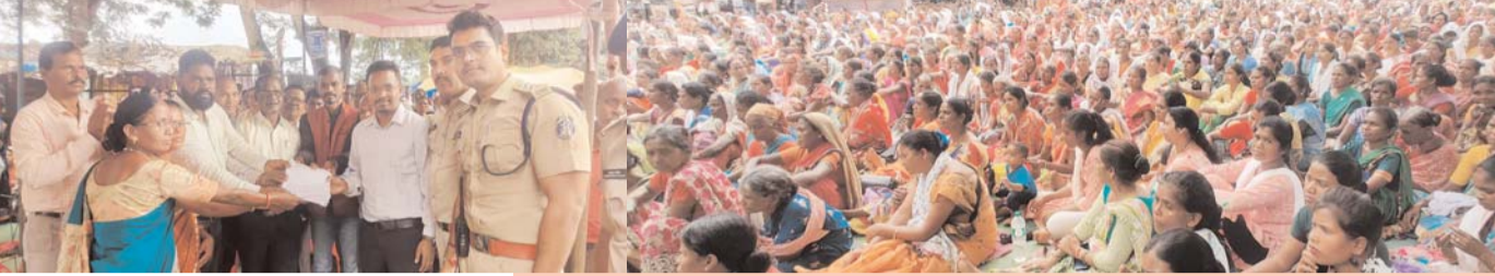
पायनियर संवाददाता < जशपुरनगर www.dailypioneer.com

एक पीढ़ी को आरक्षण का लाभ मिल जाने के बाद दूसरी पीढ़ी को सामान्य वर्ग की तरह प्रतिस्पर्धा कर नौकरी हासिल किए जाने के सुप्रीम कोर्ट के विचार को लेकर देशभर में एससी और एसटी समाज के द्वारा विरोध प्रदर्शन किया जा रहा है। इस मामले को लेकर बुधवार को भारत बंद का आह्वान किया गया था। जशपुर जिला मुख्यालय में भी अनुसूचित जाति एवं अनुसूचित जनजाति समाज संयुक्त मोर्चा के बैनर तले विरोध प्रदर्शन रैली का आयोजन किया गया और रणजोता स्टेडियम में एकत्रित हुई भीड़ को समाज के लोगों के द्वारा संबोधित कर केंद्र सरकार के खिलाफ नारे बाजी करते हुए सुप्रीम कोर्ट के फैसले पर समाज हित आरक्षण पर संसद में विधेयक प्रस्तुत करने की मांग की है।