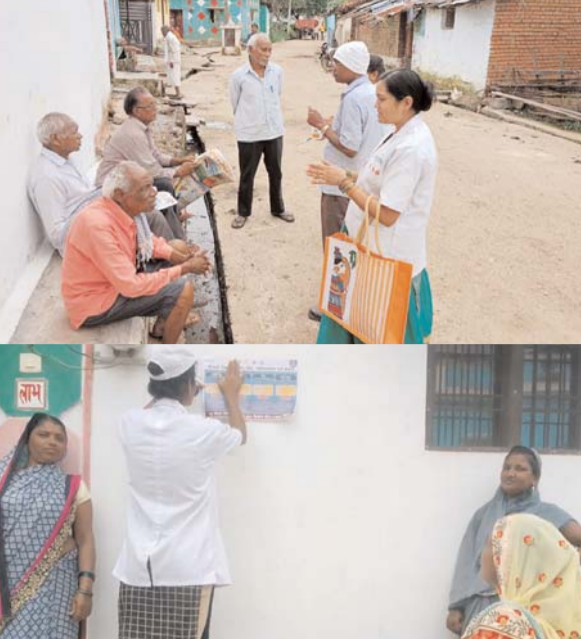
पायनियर संवाददाता < बलौदाबाजार www.dailypioneer.com