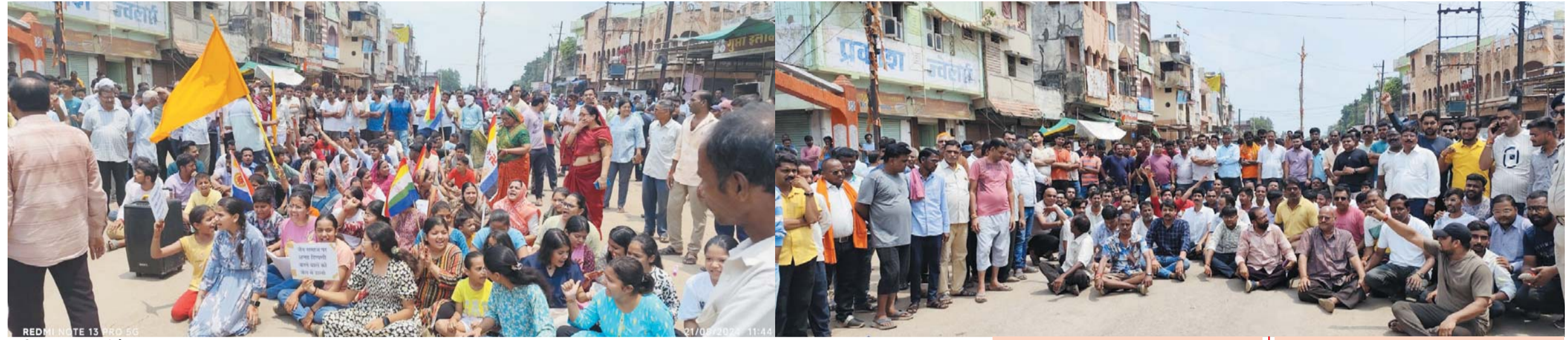
पायनियर संवाददाता डोगरगाँव नगर www.dailypioneer.com

नगर पंचायत अध्यक्ष के समर्थन में एसटी-एससी मोर्चा, एसटी-एससी मोर्चा की रैली दौरान विवाद से मचा बवाल