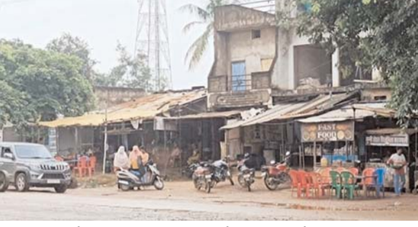
बन्द का आयोजन किया गया था। नगर में सुबह लगभग 8 बजे

सुप्रीम कोर्ट द्वारा आरक्षण को लेकर दिए गए निर्णय के खिलाफ देशभर में एसटी व एस सी संगठनों द्वारा भारत बंद का आयोजन किया गया था। यह बंद का आयोजन नगर में पूर्ण रूप से असफल साबित हुआ। सभी छोटी बड़ी दुकाने प्रतिदिन की भांति खुली रही। सुप्रीम कोर्ट के निर्णय के खिलाफ एसटी एससी ओबीसी व अन्य संगठनों द्वारा देशभर में भारत