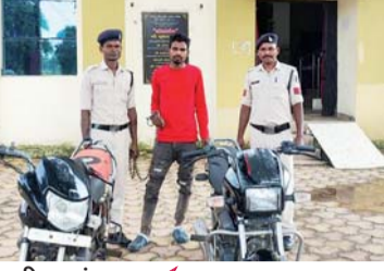
पायनियर संवाददाता < जशपुरनगर www.dailypioneer.com

राह चलते अनजान लोगों से लिफ्ट मांगकर, अनजान व्यक्ति से दोस्ती बढ़ाकर करता था चोरी