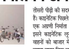
पायनियर संवाददाता < रायपुर www.dailypioneer.com

तीसरी पीढ़ी की सदस्य है, जो काइनेटिक समूह की संस्थापक है। काइनेटिक पिछले 50 वर्षों से भारत के ऑटोमोटिव क्षेत्र में एक अग्रणी निर्माता और नवाचार करने वाली कंपनी रही है, इसने काइनेटिक लूना और काइनेटिक हॉलंड जैसे प्रतिष्ठित वाहनों को बाजार में उतारा है, तथा इनके 10 मिलियन से ज्यादा वाहन बिक चुके हैं। इस कंपनी को भारत में उत्पादों के डिजाइन, उनके विकास एवं निर्माण पर ध्यान केंद्रित करते हुए, आम जनता के लिए आने-जाने के साधनों को बढ़ावा देने के लिए किफायती कीमतों पर उन्नत ऑटोमोटिव प्रौद्योगिकियों (एडवांस ऑटोमोटिव टेक्नोलॉजी) को विकसित करने और उसे बाजार में उतारने के लिए जाना जाता है। भारत में तेजी से बढ़ते ईवी बाजार में काइनेटिक ग्रीन एक अग्रणी कंपनी के रूप में उभरी है, जिसके पास इलेक्ट्रिक टू-व्हीलर, इलेक्ट्रिक थ्री-व्हीलर और गोल्फ कार्ट जैसे कई उत्पादों की विविधता है। कंपनी 100,000 से ज्यादा ईवी बेचे चुकी है।