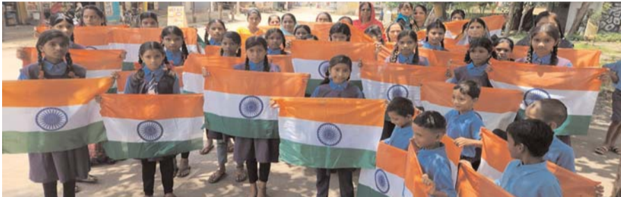
पायनियर संवाददाता < रिसाली www.dailypioneer.com

राष्ट्रवापी तिरंगा अभियान में रिसाली एन.यू.एन.एल.एम. की महिलाएं राष्ट्रीय ध्वज लेकर घर-घर दस्तक दे रही हैं। वे झंडा देकर 15 अगस्त को घरों पर तिरंगा लगाने की अपील कर रही हैं। आयुक्त मोनिका वर्मा के मार्गदर्शन में डुण्डेरा मॉडल स्कूल के बच्चों ने भी रैली निकालकर घर-घर तिरंगा लगाने नारे भी लगाए।