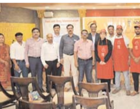
पायनियर संवाददाता < रायपुर www.dailypioneer.com

फूड सैफ्टी और सेफ्टी को बेहतर बनाने के लिये 1,000 से ज्यादा स्ट्रीट वेंडर्स को प्रशिक्षित किया जायेगा। नेस्ले इंडिया ने छत्तीसगढ़ में 'सर्व सेफ फूड' प्रोजेक्ट का विस्तार किया है। इसके लिये कंपनी ने एफडीए, छत्तीसगढ़ और नेशनल एसोसिएशन ऑफ स्ट्रीट वेंडर्स ऑफ इंडिया के साथ अपनी सहयोगी जारी रखी है। इसके अंतर्गत रायपुर, बिलासपुर, दुर्ग और महासमुंद जिलों में 1,000 से ज्यादा स्ट्रीट फूड वेंडर्स