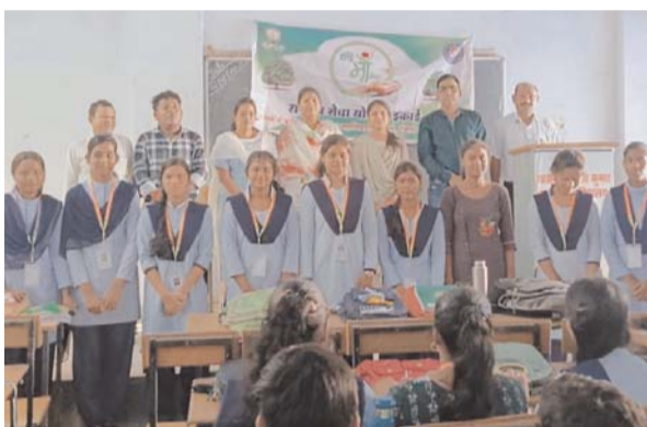
पायनियर संवाददाता सक्ती

राष्ट्रीय सेवा योजना के तत्वाधान में शासकीय क्रांति कुमार भारतीय स्नातकोत्तर अग्रणी महाविद्यालय सक्ति में दिनांक- 12 अगस्त 2024 को विश्व हाथी दिवस, अंतर्राष्ट्रीय युवा दिवस और नशामुक्ति पर शपथ कार्यक्रम आयोजित किया गया। शासन के निर्देशानुसार इन विषयों पर कार्यक्रम आयोजित किया गया। छात्र छात्राओं को हाथियों के संरक्षण, उनकी विलुप्ति के कारण और उनकी संख्या में वृद्धि के लिए संदेश दिया गया और शपथ दिलाया गया,