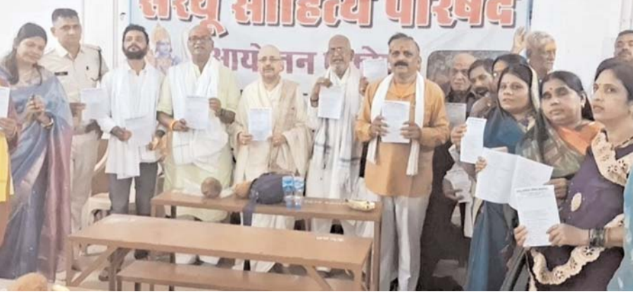
पायनियर संवाददाता < भाटापरा www.dailypioneer.com

सरयू साहित्य द्वारा रामायण ज्ञान परीक्षा आयोजन, तुलसी जयंती पर परीक्षा एवं आख्यान की भव्य छटा निखरी