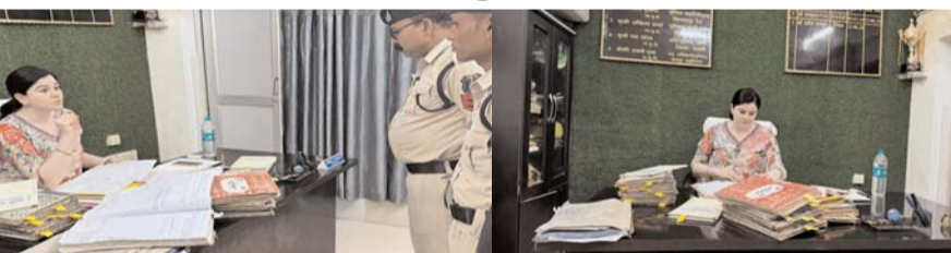
पायनियर संवाददाता सक्ती