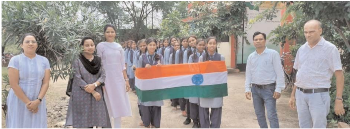
पायनियर संवाददाता सुगोली