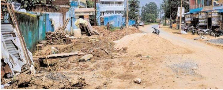
पायनियर संवाददाता < रामानुजगंज www.dailypioneer.com

क्या स्वतंत्रता दिवस पर भी सड़क रहेगा जाम, ऐसे में हर घर तिरंगा अभियान कैसे होगा सफल