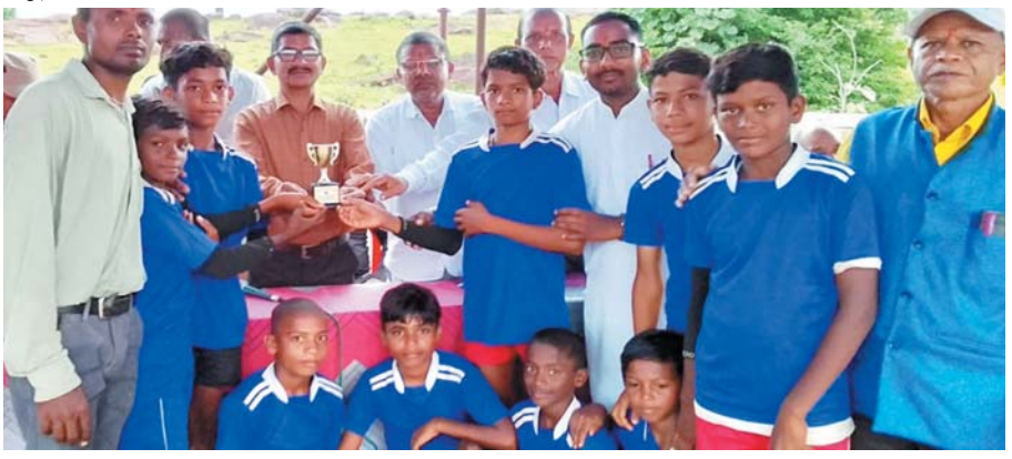
पायनियर संवाददाता < डोंगरगांव नगर www.dailypioneer.com

ब्लॉक के ग्राम खुजुजी में 2 दिवसीय संकुल स्तरीय बौद्धिक एवं खेल प्रतियोगिता का समापन हुआ। सरस्वती शिबु मंदिर द्वारा आयोजित इस संकुल स्तरीय खेल में अलग अलग विधाओं में आसरा, अजुनी, मोहड़, आमगांव,