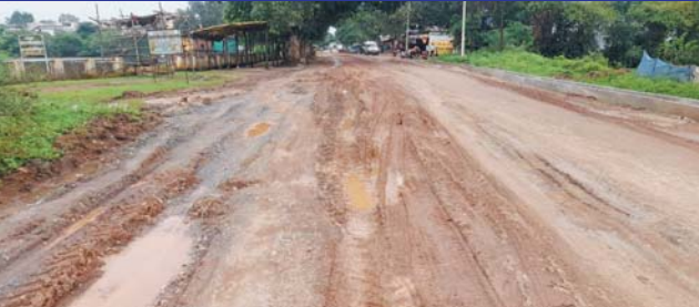
सिडप्ली ने पुरु करवाई मरम्मत लेकिन सामग्री सड़क नहीं, मान-नवीवला भी जकी