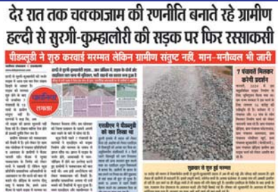
देर रात तक चक्काजाम की रणनीति बनाते रहे ग्रामीण हल्दी से सुरगी-कुम्हालोरी की सड़क पर फिर रसाकरी