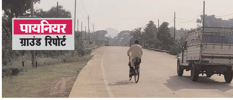
पायनियर ग्रांड रिपोर्ट

अस्पताल बड़ी जरूरत मूलभूत सुविधाओं में स्वास्थ्य सुविधा को सबसे पहला स्थान दिया गया है। बिना अच्छे स्वास्थ्य के शारीरिक और मानसिक विकास