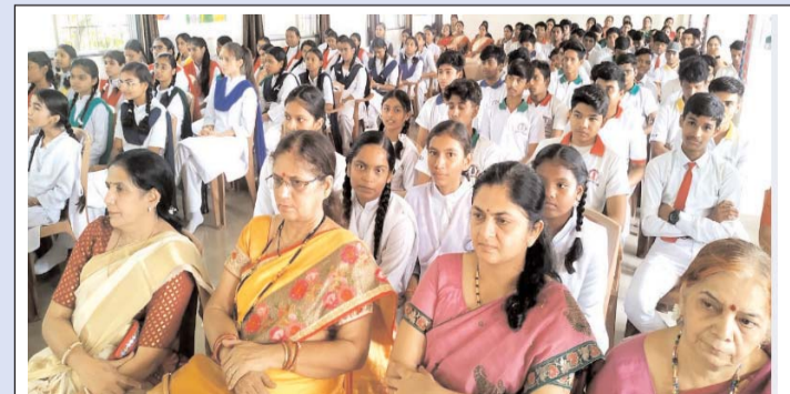
महाराष्ट्र मंडल के संत ज्ञानेश्वर स्कूल में छात्र परिषद गठन और शपथ ग्रहण समारोह में उपस्थित मंडल के कार्यकारिणी सदस्य व छात्र-छात्राएं।