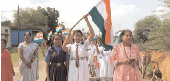
पायनियर संवाददाता < जशपुरनगर www.dailypioneer.com

भारत सरकार के आदेशानुसार प्रत्येक स्कूलों में स्वतंत्रता सप्ताह 09 से 15 अगस्त के दौरान हर घर तिरंगा कार्यक्रम के तहत कस्तूरबा गांधी बालिका आवासीय विद्यालय भाटापारा के छात्राओं एवं शिक्षिकाओं द्वारा रैली निकाली गई जिससे लोगों में देशभक्ति एवं तिरंगी झंडे के प्रति सम्मान की भावना जागृत हो तिरंगा हमारी शान है भारत की पहचान है तिरंगा झंडा राष्ट्र का प्रतीक एवं गौरव है लोगों को तिरंगी झंडे का सम्मान करते हुए घर-घर में लहराने के लिए जागरूकता रैली