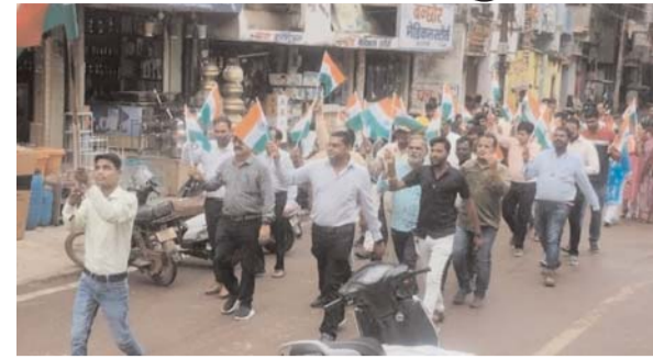
पायनियर संवाददाता < भिलाई-3 www.dailypioneer.com