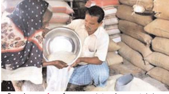
पायनियर संवादकर्ता < कवर्धा www.dailypioneer.com

सार्वजनिक वितरण प्रणाली अंतर्गत जिले में लगभग पांच सौ उचित मूल्य की दुकानें संचालित हैं। जहाँ से राशनकार्ड धारियों को चावल, शक्कर, चना, नमक और मिट्टी तेल किफायती दर पर वितरण किया जाता है। दुकान को नियमित रूप से खोलने के लिए कलेक्टर ने निर्देश भी जारी किया है।