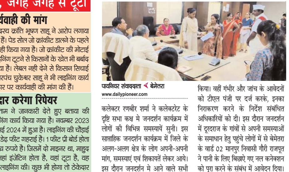
पायनियर संवादकर्ता < बेमेतरा www.dailypioneer.com

पर भी सवाल उठ रहे हैं। वहीं निर्माण कार्य जांच के दायरे में हैं। दरअसल गुंडरेदेली विधानसभा क्षेत्र में खरखरा-मोहीदीपाठ नहर नाली से ग्राम भरदकला से चौरचार तक सीमेंट की पक्की