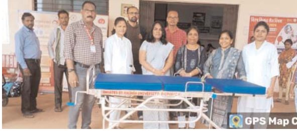
पायनियर संवाददाता < रायपुर www.dailypioneer.com

कलिंगा विश्वविद्यालय मध्य भारत का एक प्रतिष्ठित शैक्षणिक संस्थान है। जहाँ पर वैश्विक मापदंड के अनुरूप उच्च गुणवत्तापूर्ण और अनुसंधान केन्द्रित शिक्षा प्रदान करने के साथ-साथ अपनी सामाजिक जिम्मेदारी का भी निर्वाह किया जाता रहा है। जनहित के इसी उद्देश्य को ध्यान में रखते हुए कलिंगा विश्वविद्यालय द्वारा ग्रामीण क्षेत्र में स्थित शासकीय चिकित्सालयों के विकास के लिए आवश्यक सामग्री का वितरण किया जाता रहा है। इसी क्रम में कलिंगा विश्वविद्यालय द्वारा शासकीय चिकित्सालय आरंग को हाइड्रोलिक डिलीवरी टेबल भेंट किया गया। प्रसूति वार्ड में डिलीवरी टेबल एक महत्वपूर्ण उपकरण है, जो माँ और नवजात शिशु दोनों की सुरक्षा और