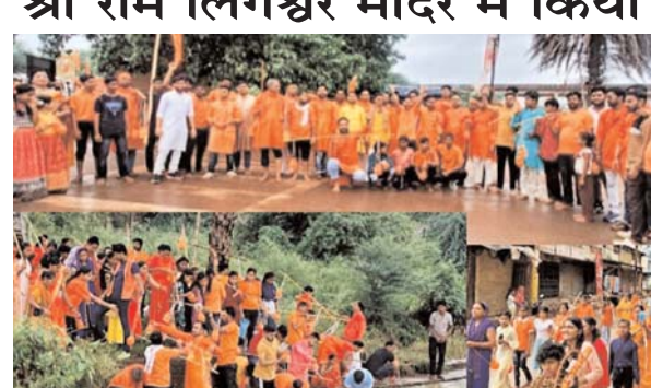
पायनियर संवादकर्ता < कुम्हारी www.dailypioneer.com

सावन का मास चल रहा है, भगवान शंकर को यह माह अत्यंत प्रिय है। भक्तगण भगवान शंकर को प्रसन्न करने के लिए कावड़ में जल लेकर भगवान