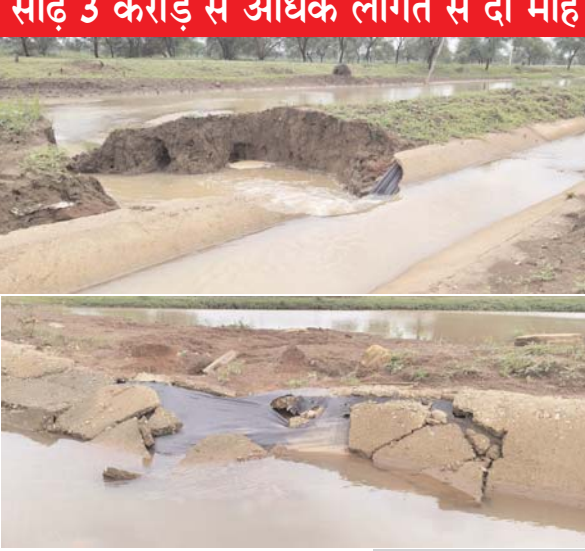
पायनियर संवादकर्ता < बालोद www.dailypioneer.com

जिले में पहली बारिश ने हुए निर्माण कार्य के गुणवत्ता पीओकी पोल खोल कर रख दी है। साढ़े 3 करोड़ से अधिक लागत से दो माह पूर्व बनी 5 साल की गांरटी वाली नहर लाइनिंग भ्रष्टाचार की भेंट चढ़ गई है। गुंडरेदेली विधानसभा के ग्राम भरदकला से चौरचार तक 8 किमी तक नहर लाइनिंग जगह जगह से टूट गई है। साफ नजर आ रहा है कि गुणवत्ता को ताक में रखकर ठेकेदार के