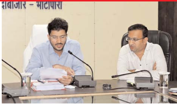
लंबित पेंशन प्रकरणों के निराकरण के लिए विशेष शिविर आयोजन करने के निर्देश

हासिल की जा रही है इसके लिए सभी अनुविभाग से रिकॉर्ड खंगाले जा रहे हैं। ताकि उक्त भूमि के रजिस्ट्री को रद्द किया जा सके। इसके लिए शासन द्वारा निर्धारित न्यायलीन प्रक्रिया अपनाई जाएगी। इसके साथ ही कलेक्टर ने कहा कि आरबीसी 6-4 के तहत राहत एवं आपदा से संबंधित प्रकरणों में संवेदनशील होकर तत्काल निराकृत करें ताकि प्रभावित व्यक्तियों को लंबित पेंशन प्रकरणों के निराकरण के लिए विशेष शिविर आयोजन करने के निर्देश