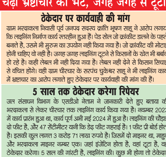
पायनियर संवादकर्ता < बेमेतरा www.dailypioneer.com

भ्रष्टाचार किया गया है। इतना ही नहीं कार्य स्थल पर कहीं भी सूचना पटल की जानकारी प्रदर्शित नहीं की गई है। जिसके साथ ही जल संसाधन विभाग के जिम्मेदार अधिकारियों की कार्यप्रणाली