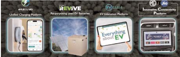
पायनियर संवाददाता < रायपुर www.dailypioneer.com

जेएसडब्ल्यू एमजी मोटर इंडिया ने DrEV.Bharat में इलेक्ट्रिक वाहनों (ईवी) के लिए इन्वेंशन को एक श्रृंखला को पेश किया। इस कार्यक्रम का आयोजन कंपनी की ओर से भारत मंडप, नई दिल्ली में विविधतापूर्ण ऑटोमोटिव और ईवी ईकोसिस्टम के अग्रणी इंडस्ट्री खिलाड़ियों के साथ मिलकर किया गया था। अपनी तरह का पहला यह कार्यक्रम ईवी तकनीक को आगे बढ़ाने और इलेक्ट्रिक वाहनों को तेजी से अपनाने के साथ परेशानों मुक्त स्वामित्व अनुभव प्रदान करने के लिए मजबूत ईवी बुनियादी ढांचे के निर्माण के लिए निर्माताओं के ट्रस्ट प्रतिक्रिया को दर्शाता है। इस कार्यक्रम में एमजी ईव्ब को लॉन्च किया गया, जो एक ऑईएम की ओर से इंडस्ट्री का पहला और सबसे बड़ा चार्जिंग प्लेटफॉर्म है, प्रोजेक्ट रिवाइव, कारों के अलावा ईवी बैटरी को पुनः उपयोग करने पर केंद्रित है, ईवीपीडिया, इलेक्ट्रिक कार यूजर्स के लिए भारत का पहला सर्वांगीर शैक्षणिक और जानकारी भरा प्लेटफॉर्म, एमजी-जियो