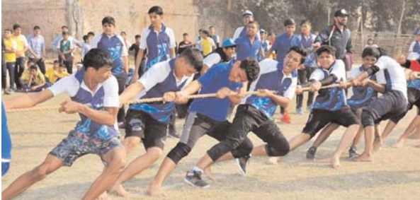
पायनियर संवाददाता < भाटापारा www.dailypioneer.com

नया शिक्षा सत्र, स्कूल के द्वार पर दस्तक दे चुका है लेकिन खंड क्षेत्र की दर्जन भर स्कूलों में व्यायाम कक्षाओं का संचालन सवालियों के घेरे में है क्योंकि इन स्कूलों में व्यायाम शिक्षक के पद रिक्त है। जिला शिक्षा