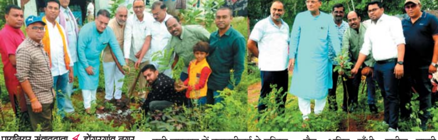
पायनियर संवाददाता डोंगरगांव नगर www.dailypioneer.com

जिला प्रशासन के मंशानुरूप प्रेस क्लब डोंगरगांव एवं व्यापारीवर्ग के सहयोग से नगर में जारी हरियर अभियान के दूसरे चरण में हेरली पर्व दिवस वृहद पौधारोपण किये गए। दूसरे चरण का पौधारोपण पुलिस थाना चौक तिराहा से लेकर आजाद चौक तिराहा मटियावाड़ तक किया गया है। व्यापारीवर्ग ने पौधारोपण कर पौधों को ट्रीगार्ड से सुरक्षित भी किया। उल्लेखनीय है कि पर्यावरण संरक्षण व नगर को चहूँओर से वनाच्छादित करने के उद्देश्य से नगर के सभी वर्ग बड़-चढ़कर हिस्सा लेते हुए महती जिम्मेदारी निभा रहे हैं।