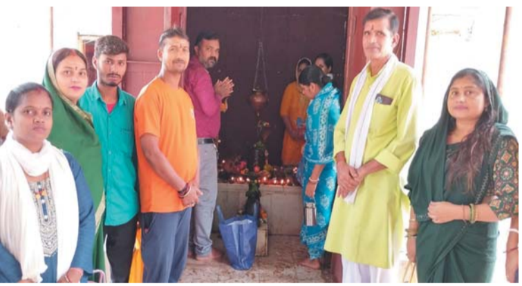
पायनियर संवाददाता < किरंदुल www.dailypioneer.com

श्रावण माह के तृतीय सोमवार को भगवान महादेव के मंदिरों में विशेष पूजा अर्चना की गई। 105 अगस्त सोमवार को लौहगरी किरंदुल के अलग अलग स्थानों में स्थित शिवालयों