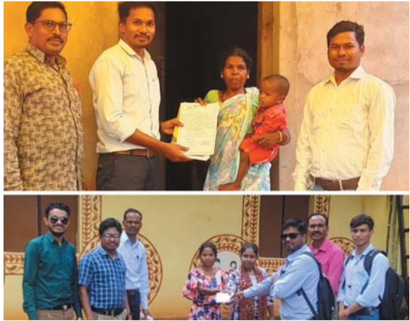
पायनियर संवाददाता < कोण्डागांव www.dailypioneer.com

छत्तीसगढ़ शासन स्कूल शिक्षा विभाग के निर्देशानुसार शैक्षणिक सत्र 2024-25 में राज्य के समस्त शैक्षणिक संस्थाओं में पालक शिक्षक बैठक होना है। जिला शिक्षा विभाग समग्र शिक्षा से