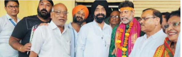
पायनियर संवाददाता डोंगरगढ़ www.dailypioneer.com