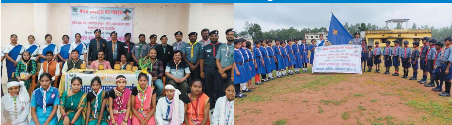
पायनियर संवाददाता < कोण्डागांव www.dailypioneer.com

छात्र-छात्राओं में राष्ट्रीयता की भावना जागृत हो सके : महेंद्र नाथ पांडे