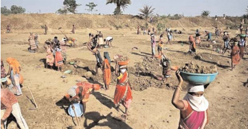
भुगतान नहीं होने की बात सुनकर मायूस होकर वापस चले जाते हैं इस बीच ग्रामीण मजदूर सरकार

2 लाख और फिरोजपुर 5 करोड़ 95 लाख एम्प्लूया 8 करोड़ जबकि गरियाबंद 6 करोड़ और मैनपुर विकासखण्ड की 7 करोड़ 73 लाख की मजदूर भुगतान पेंडिंग बताया जा रही है। फिर अब तक ऑनलाइन भुगतान की प्रक्रिया शुरू हो रही है जिसे लेकर गांव गांव के अधिकांश मजदूरों में नाराजगी देखने को मिल रहा है खासकर महिलाओं में नाराजगी है क्योंकि वर्तमान में स्कूली बच्चों को काफी किताब से लेकर तमाम वस्तु उपलब्ध कराना होता है इसके अलावा फिलहाल कोई काम नहीं होने के चलते किसी प्रकार मजदूरी नहीं मिलने पर परिवार का भरण पोषण मुश्किल हो रहा है और इसके मद्देनजर कई मजदूर अक्सर सरपंच सचिव रोजगार सहायक के चक्र लगाने को मजबूर होते हैं लेकिन ऑनलाइन