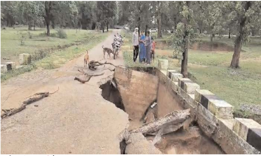
पायनियर संवाददाता < मोहला/मानपुर

पुलिस जवानों के सुरक्षा घेरे में साल भर पहले बनी थी सड़क-पुलिया, पहाड़ में कई जगह बारिश से सड़क उखड़ गई, नाली नहीं बनाया