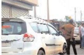
फोरलेन में मौत व शिकायत के बाद पहुंचे अफसर

फोरलेन की जांच के नाम पर खानापूर्ति कर गए अफसर