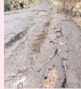
मार्ग की स्थिति बदतर

भी आवागमन प्रभावित हो गया है। पखवाड़े भर से मानपुर इलाके में छत्तीसगढ़ को महाराष्ट्र से जोड़ने वाला नेशनल हाइवे 930 अवरुद्ध है। भारी बारिश के बीच यहां निर्माणाधीन पुल-पुलियों की एप्रोच रोड बह जाने से यह हालात बने हैं। इन परिस्थितियों में प्रशासन ने मार्ग डायवर्ट कर आवागमन की व्यवस्था बनाई है। इस बीच ग्राम गट्टाहन व संबलपुर के बीच पुल के ध्वस्त हो जाने से एक नई समस्या खड़ी हो गई।