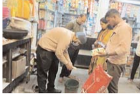
शामिल है। इस दौरान निहाल डेली निड्स से पनीर व सोनापन्ड़ी का लौगल नमूना लेकर गुणवत्ता परीक्षण हेतु प्रयोगशाला भेजा गया। वहीं जनता स्टैटोर्ट, मनोहर होटल, तल व गुजराती होटल से तेल का