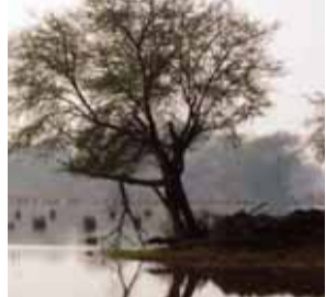
और प्रबंधन प्रथाओं में गंभीर कमी पाई गई है। ईएसजेड जोनल योजना और अधिभूचना के उल्लंघन से क्षेत्र में विकास दबाव बढ़ने की उम्मीद है, जिससे पार्क का पारिस्थितिकी तंत्र

के नेतृत्व में राष्ट्रीय वन्यजीव बोर्ड (एनबीडब्ल्यूएल) की स्थायी समिति के सदस्यों ने महानिरीक्षक (वन्यजीव) के नेतृत्व में रिपोर्ट में की गई टिप्पणियों पर विस्तार से चर्चा की, जो विशेष रूप से चिंताजनक थीं। इस हद तक कि यह 'वांछित होने के लिए बहुत कुछ छोड़ देता है।' रिपोर्ट में कहा गया है कि राष्ट्रीय उद्यान के एक सीमा से घिरे होने और वन और वन्यजीव विभाग के सक्रिय उपायों के कारण इसके आवासों को बड़े पैमाने पर संरक्षित किए जाने के बावजूद, ईएसजेड के भीतर शासन