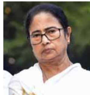
मुद्दे के संबंध में 'सामान्य जवाब' बताया।

बलात्कार के मामलों में कड़े कानून बनाने की मांग करते हुए प्रधानमंत्री नरेंद्र मोदी को अपना पहला पत्र लिखने के एक हफ्ते के भीतर बंगाल की मुख्यमंत्री ममता बनर्जी ने शुक्रवार को उन्हें दूसरा पत्र लिखकर पहले की मांग दोहराई और साठहत्तर वर्षों में उनके पहले संदेश को मिला कथित फौकी प्रतिक्रिया पर निराशा व्यक्त की। बंगाल की सीएम का यह पत्र कोलकाता के आरजी कर मेडिकल कॉलेज अस्पताल में स्नातकोत्तर महिला डॉक्टर के बलात्कार और हत्या के खिलाफ देशव्यापी विरोध प्रदर्शन की पृष्ठभूमि में भेजा गया है। बनर्जी ने असंतोष की भावना के साथ लिखा, 'आप कृपया 22 अगस्त, 2024 को मेरे पत्र संख्या 44-सीएम को याद कर सकते हैं,' हालांकि ऐसे मुद्दों पर तत्काल ध्यान देने की आवश्यकता है, लेकिन अभी तक उनसे कोई जवाब नहीं मिला है। मुख्यमंत्री ने अपने दूसरे पत्र में लिखा, 'इस तरह के संवेदनशील मुद्दे पर आपकी ओर से कोई जवाब नहीं मिला,' हालांकि उन्होंने उल्लेख किया कि उन्हें वास्तव में महिला एवं बाल विकास मंत्री से एक सामान्य पत्र मिला था, जिसे उन्होंने एक गंभीर