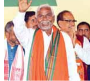
रांची में शुक्रवार को एक समारोह में भाजपा में शामिल होने के बाद झारखंड के पूर्व मुख्यमंत्री चंपई सोरेन केंद्रीय मंत्री शिवराज सिंह चौहान के साथ समर्थकों की ओर हाथ हिलाते हुए।