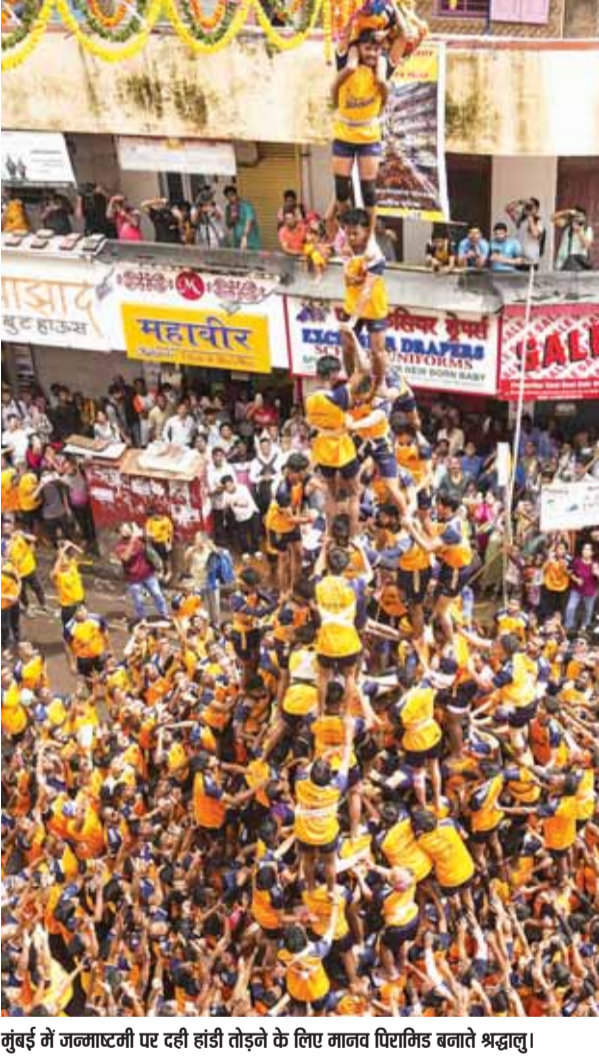
मुंबई में जल्लादजी एट दही हांडी तोड़ने के लिए गानव पिशाडि बनावते श्रद्धालु।