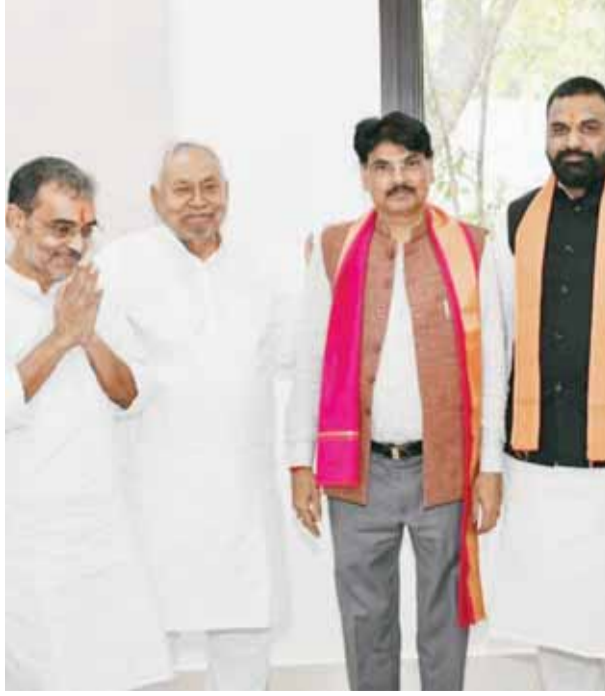
बिहार से राज्य सभा सदस्य चुने जाने के बाद मनन कुमार मिश्रा व उपेन्द्र कुशवाहा को बहाई देते सीएन नीतीश कुमार व भाजपा नेता सम्राट चौधरी