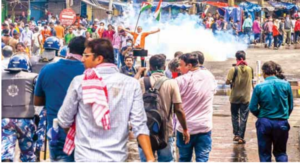
कोलकाता में मंगलवार को पश्चिम बंगाल सचिवालय की तरफ विरोध मार्च के दौरान सुरक्षा कर्मियों और छात्रों के बीच जमकर झड़प हुई।

कोलकाता के एक मेडिकल कॉलेज में महिला डॉक्टर के साथ बलात्कार और हत्या के विरोध में प्रदर्शन कर रहे छात्रों और पुलिस के बीच कोलकाता और हावड़ा के विभिन्न स्थानों पर रक्त-रक्त कर रहे झड़पों में पुलिस कर्मियों सहित कई लोग घायल हो गए और काफी संख्या में अन्य को गिरफ्तार कर लिया गया। पश्चिम बंग छात्र समाज के बैनर तले छात्रों ने - विपक्षी भाजपा के स्पष्ट समर्थन के साथ - मुख्यमंत्री ममता बनर्जी के इस्तीफे की मांग करने के लिए राज्य सचिवालय नवजा की ओर मार्च किया, जब झड़पें हुईं। शुरुआती धक्का-मुक्की झड़पों में बदल गई, पुलिस ने बार-बार आंसू गैस छोड़ी, पानी की बोछार की और लाठीचार्ज किया, क्योंकि उत्तेजित आंदोलनकारियों, जिनमें कई महिलाएं भी शामिल थीं, ने पीछे हटने से इनकार कर दिया। प्रशासन के सूत्रों ने कहा कि रक्त-रक्त कर लड़ाई पांच घंटे से अधिक समय तक जारी रही, जिससे पुलिस को काफी परेशानी हुई, अतिरिक्त बल और आरएफ को पड़ोसी जिलों से बुलाना पड़ा।