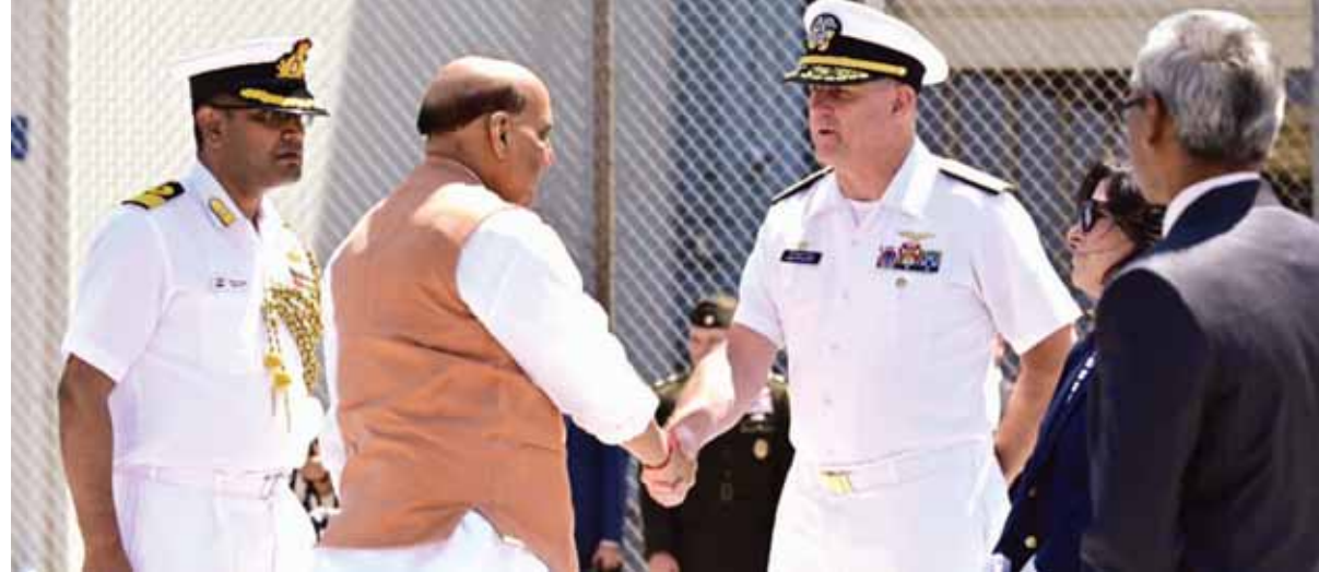
अमेरिका के मैरीलैंड के कार्डेरोक में नौसेना सरफेस वॉर सेंटर के दौरे पर पहुंचे केंद्रीय रक्षा मंत्री राजनाथ सिंह व अन्य। (समाचार पृष्ठ 11)