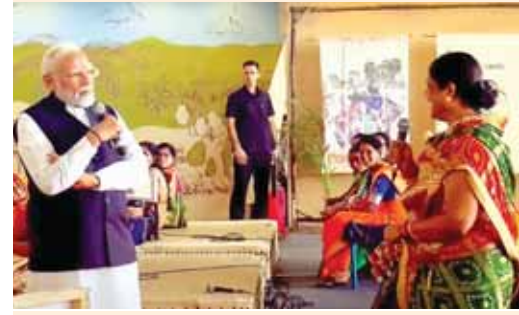
महाराष्ट्र के जलगांव में रविवार को प्रधानमंत्री नरेंद्र मोदी 'लखपति पीटी' के साथ बातचीत करते हुए।