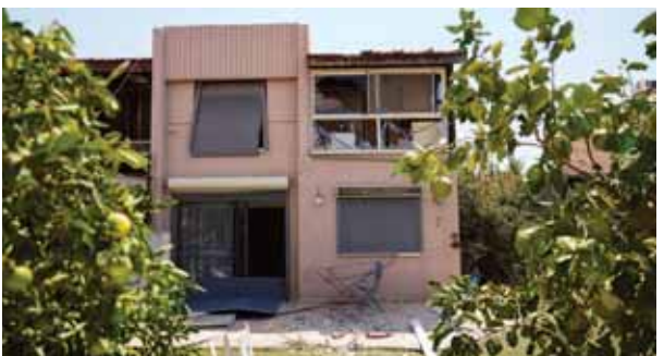
इजराइली हमले के बाद लेबनान में क्षतिग्रस्त घरों को देखा जा सकता है। यरूशलम

इजराइली सेना ने शिया मिलिशिया हिजबुल्ला के ठिकानों को निशाना बनाकर रविवार तड़के दक्षिणी लेबनान में हवाई हमले किए जिसके कुछ ही घंटे बाद हिजबुल्ला ने बड़ी संख्या में रॉकेट और ड्रोन दागकर इजराइल पर हमला किए जाने की घोषणा की। भारी गोलीबारी से ऐसा प्रतीत नहीं होता कि लंबे समय से आशंका जताई जा रही जंग भड़क गई है, लेकिन स्थिति तनावपूर्ण बनी हुई है। इस बीच, मिस्र रविवार को गाजा में 10 महीने पुराने इजराइल-हमास युद्ध में संघर्ष विराम कराने के उद्देश्य से उच्च स्तरीय वार्ता की मेजबानी कर रहा है, जिससे राजनयिकों को उम्मीद है कि क्षेत्रीय तनाव कम होगा। इजराइली सेना ने कहा कि उसने इसलिए हमला किया क्योंकि हिजबुल्ला इजराइल की ओर रॉकेट और मिसाइलों की भारी बौछार करने की योजना बना रहा था। इसके तुरंत बाद, हिजबुल्ला ने घोषणा