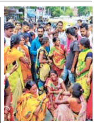
जहानाबाद में बाबा सिद्धनाथ मंदिर में मची भगदड़ में जान गवाने वाले लोगों परिजन। बिहार के मंदिर में मची भगदड़, सात की मौत जहानाबाद/पटना