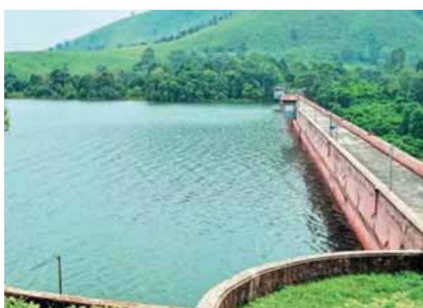
भोले-भाले त्रावणकोर के साथ किया गया एक बड़ा धोखा है। रामास्वामी अय्यर ने 1947 में ही इस बारे में तत्कालीन वायसराय लॉर्ड माउंटबेटन को बताया था। वायसराय से मिलने के बाद तैयार किए गए अपने नोट्स