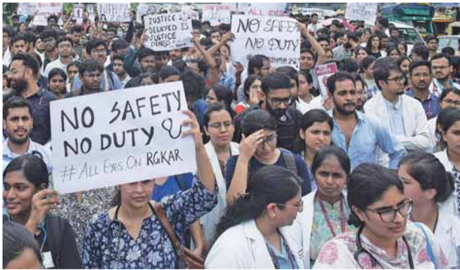
कोलकाता में ट्रेनी डॉक्टर से रेप और हत्या के विरोध में नई दिल्ली में डॉक्टरों ने प्रदर्शन किया। फोटो: रंजन डिगती

भारत भर के विभिन्न अस्पतालों के डॉक्टरों ने सोमवार से अपनी अनिश्चितकालीन हड़ताल शुरू कर दी है, जिसमें सभी वैकल्पिक सेवाएं - अनुसूचित, गैर-जरूरी प्रक्रियाएं और ब्लाक रोगी सेवाएं - तब तक के लिए बंद कर दी गई हैं, जब तक कि कोलकाता के एक डॉक्टर के साथ कथित बलात्कार और हत्या की निष्पक्ष जांच नहीं हो जाती। प्रशिष्ठ मेडिको कोलकाता में सरकारी आरजी कर मेडिकल कॉलेज और अस्पताल में काम करती थी, और उसका शव शुक्रवार को सुबिधा के सेमिनार हॉल के अंदर पाया गया, जिससे चिकित्सा समुदाय में आक्रोश फैल गया। जबकि वैकल्पिक सेवाओं के कारण ओपीडी में आने वाले कई मरीजों को परेशानी का सामना करना पड़ा, हालांकि, अस्पतालों में गंभीर मरीजों की जरूरतों को पूरा करने के लिए आपातकालीन देखभाल चालू रही। राष्ट्रव्यापी अनिश्चितकालीन हड़ताल का नेतृत्व फेडरेशन ऑफ रेजिडेंट डॉक्टरों ने एसोसिएशन (फोर्ड) ने किया है और दिल्ली मेडिकल एसोसिएशन (डीएमए) भी हड़ताल पर गए डॉक्टरों के समर्थन में सामने आया है। आरएमएल अस्पताल, आरडीए के महासचिव डॉ. सर्वेश