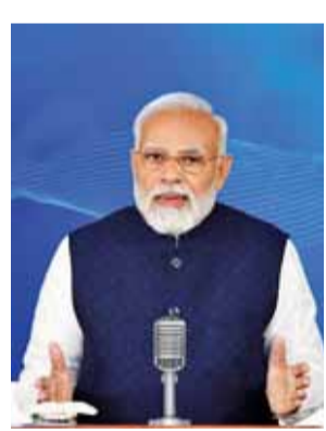
बाद शुरू किया जाना चाहिए। पत्र में कहा गया, यह समारोह प्रोटोकॉल-आधारित आमंत्रितों के अलावा विविध

वाले कार्यकर्ता और महिला सरपंच (ग्राम प्रधान) भी समारोह के लिए आमंत्रित किए जाने वाली केंद्रीय गृह मंत्रालय द्वारा साझा की गई सूची का हिस्सा है। प्रत्येक राज्यपाल और उपराज्यपाल स्वतंत्रता दिवस और गणतंत्र दिवस के शोम को अपने आधिकारिक निवास - राजभवन या राज निवास - पर संबंधित मुख्यमंत्री, मंत्रियों, शीर्ष प्रशासनिक, पुलिस अधिकारियों, प्रमुख नागरिकों के लिए जलपान का आयोजन करते हैं। इस कार्यक्रम को एट होम कहा जाता है। सभी राज्यों के मुख्य सचिवों को भेजे गए पत्र में गृह मंत्रालय ने कहा कि एट होम समारोह शाम छह बजे के