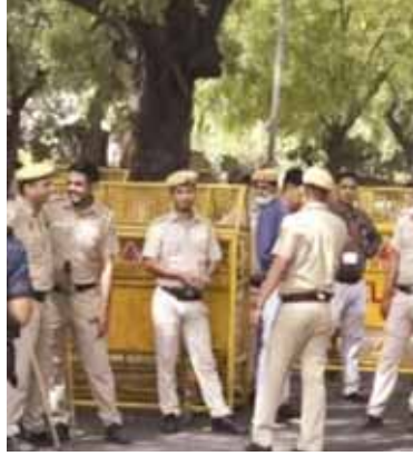
पार्यायनियर समाचार सेवा/एजेंसियां। नई दिल्ली

पश्चिम एशिया अराजकता और तनाव में घिरा हुआ है, वहीं तेहरान में हमास नेता की हत्या के मद्देनजर खुफिया एजेंसियों के अलर्ट के बाद दिल्ली पुलिस ने इजरायली दूतावास और चबाड हाउस की सुरक्षा की समीक्षा की है। दोनों के आसपास कई सीसीटीवी कैमरे लगाकर पहले से ही बहुस्तरीय सुरक्षा व्यवस्था की गई है। एक वरिष्ठ अधिकारी के मुताबिक, जरूरत पड़ने पर उनका अंगरक्षक एक हवाई हमले में मारे गए, जो तेहरान में हनिशेह द्वारा उपयोग किए जाने वाले आवास पर हमला किया गया था। सूत्रों के मुताबिक, दिल्ली पुलिस बल के वरिष्ठ अधिकारियों ने राष्ट्रीय राजधानी में दो इजरायली इमारतों के आसपास व्यापक सुरक्षा जाल की योजना बनाने के लिए एक बैठक की है।