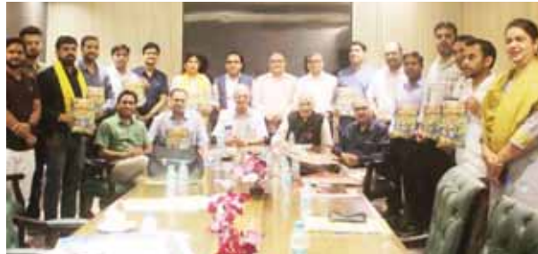
नई शिक्षा नीति-2020 पर मंथन के लिए संगोष्ठी में मौजूद सूर्या फाउंडेशन के सदस्य।