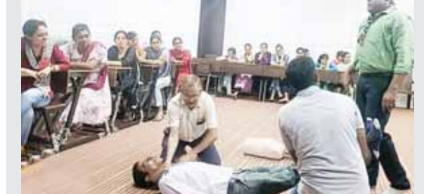
जगन्नाथ बाल गृह आश्रम में भारत स्काउट्स एंड गाइड तथा प्राथमिक सहायता शिबिर में प्रशिक्षण देते विशेषज्ञ।