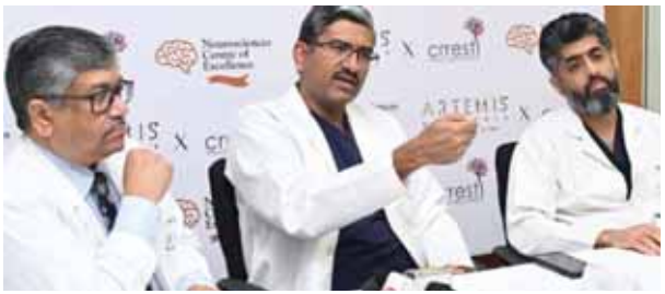
स्ट्रोक को लेकर शुरू किए गए समय कार्यक्रम की जानकारी देते चिकित्सक।