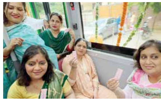
मोहल्ला बस सेवा का ट्रायल के दौरान सफर करती महिलाएँ।

आम आदमी पार्टी की सरकार राष्ट्रीय राजधानी में लास्ट-माइल कनेक्टिविटी को बेहतर बनाने के लिए मोहल्ला बस सेवा का ट्रायल शुरू किया है। इसका मकसद अलग-अलग रूटों पर मोहल्ला बसों को चलाकर यह देखा जा रहा है कि उनके परिचालन में कहीं कोई दिक्कत तो नहीं आ रही है। इससे मोहल्ला बस सेवा के प्रति लोगों का फीडबैक जानने और रूटों में जरूरी सुधार करने में भी काफी मदद मिल रही है। इस सिलसिले को आगे बढ़ाते हुए परिवहन विभाग ने बुधवार से दो और नए रूटों पर मोहल्ला बसों का ट्रायल शुरू किया है। पहला रूट है कैलाश कॉलोनी मेट्रो स्टेशन से पीएनबी गीताजलि कॉलोनी तक। दूसरा रूट है लोक कल्याण मार्ग मेट्रो स्टेशन से वसंत विहार मेट्रो स्टेशन तक। ये रूट जेएम्सी, मैट्रो वेंकटेश्वर, एआरएसडी, आरएलए, मोतीलाल नेहरू जैसे 6-7 साइड कैम्पस कॉलेजों को कवर करेंगे। इससे दक्षिणी दिल्ली और नई दिल्ली के लोगों को लास्टमाइल कनेक्टिविटी का एक नया