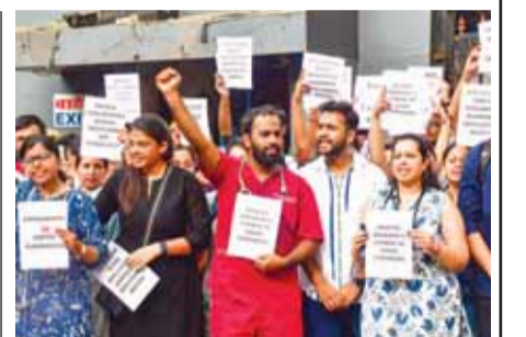
गुंगई में नायर अस्पताल पर डॉक्टर और मेडिकल छात्र विरोध प्रदर्शन करते हुए