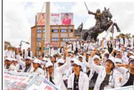
कोलकाता के हबली स्थित रानी चेनन्ना सर्किल पर विरोध प्रदर्शन करते जुनियर डॉक्टर।