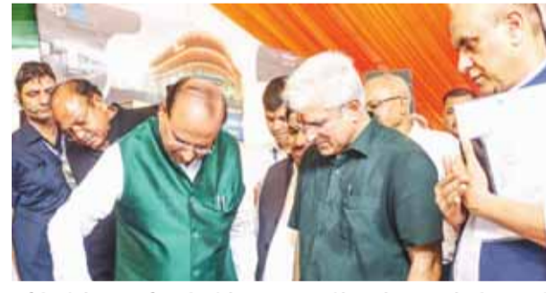
नई दिल्ली में एक कार्यक्रम दिल्ली के उपराज्यपाल वीके सक्सेना, साथ में परिवहन मंत्री कैलाश गहलोत।

मुख्यमंत्री अरविंद केजरीवाल अनुपस्थिति में राष्ट्रीय ध्वज कौन फहराएगा, इस पर अनिश्चितता मंगलवार को समाप्त हो गई जब उपराज्यपाल विनय कुमार सक्सेना ने छत्रसाल स्टेडियम में स्वतंत्रता दिवस पर राज्य स्तरीय समारोह के अवसर पर राष्ट्रीय ध्वज फहराने के लिए दिल्ली के गृह मंत्री कैलाश गहलोत को