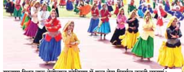
गुरुग्राम स्थित ताऊ देवीलाल स्टेडियम में फुल ड्रेस रिहर्सल करती छात्राएं।

स्वतंत्रता दिवस समारोह भव्य रूप से आयोजित करने के लिए मंगलवार फुल ड्रेस रिहर्सल आयोजित की गई। जिला स्तरीय स्वतंत्रता दिवस समारोह सेक्टर-38 स्थित ताऊ देवी लाल स्टेडियम में आयोजित किया जाएगा। समारोह में इस बार हरियाणा के लोक