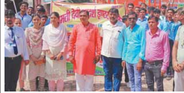
तिरंगा यात्रा में मौजूद प्रधानाचार्य व छात्र छात्राओं।

● जिलाधिकारी व जिविनि के निर्देश पर हुआ आयोजन