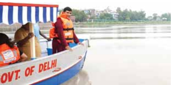
पायनियर समाचार सेवा। नई दिल्ली

यमुना नदी का जलस्तर चेतावनी निशान के करीब पहुंच गया है। इससे नदी के निचले इलाकों में बाढ़ की आशंका बढ़ गई है। पुराना रेलवे ब्रिज पर मंगलवार को पानी का स्तर 204.35 मीटर मापा गया है, जो चेतावनी निशान के करीब है।