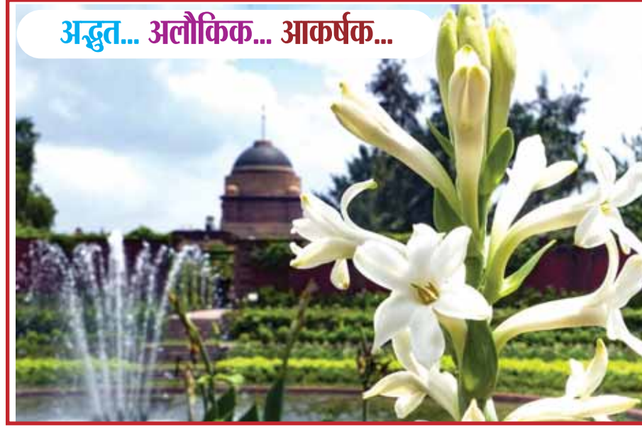
आम लोग इस बार अमृत उद्यान की खूबसूरती 16 अगस्त से 15 सितंबर तक देख सकेंगे।