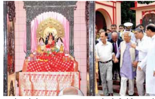
ढाका में बांग्लादेश के मुख्य सलाहकार मुहम्मद यूनुस ढाकेश्वरी मंदिर में हिंदू समुदाय के सदस्यों के साथ।

बांग्लादेश की अंतरिम सरकार के प्रमुख मोहम्मद यूनुस ने पंशान हिंदू समुदाय के सदस्यों से मंगलवार को यहां प्रसिद्ध ढाकेश्वरी मंदिर में मुलाकात की और उनकी सरकार की भूमिका के बारे में कोई धारणा बनाने से पहले धैर्य रखने का आग्रह किया।