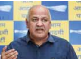
पायनियर समाचार सेवा। नई दिल्ली

स्वतंत्रता दिवस समारोह में ध्वजारोहण कौन करेगा, इस पर उठे विवाद के बीच आम आदमी पार्टी के वरिष्ठ नेता मनीष सिसोदिया ने मंगलवार को उपराज्यपाल विनय कुमार सक्सेना पर निशाना साधते हुए कहा कि किसी निर्वाचित मंत्री द्वारा ऐसा करने में कोई समस्या नहीं होनी चाहिए।