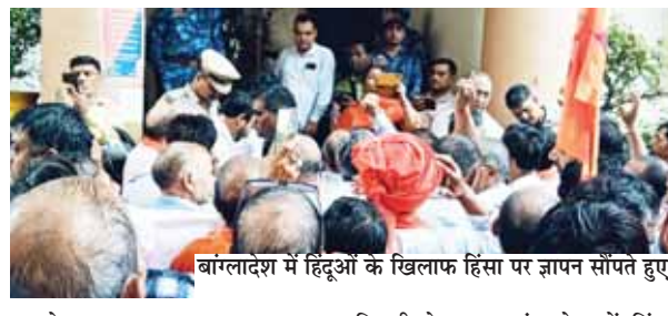
बांग्लादेश में हिंदुओं के खिलाफ हिंसा पर जापान सौंपते हुए।

बांग्लादेश में लोकतांत्रिक सरकार के तख्तापट्ट के उपरान्त अल्पसंख्यक समाज पर निरंतर हिंसक घटनाओं को लेकर विश्व हिंदू परिषद फरीदाबाद ने प्रदर्शन एवं जापान के माध्यम से रोष व्यक्त किया है। इन हिंसक घटनाओं के विरोध में महामहिम राष्ट्रपति के नाम जल्दा उपायुक्त को जापान सौंपा। उससे पहले एकत्रित हुए लोगों ने हिन्दू एकता एवं विश्व शांति को लेकर