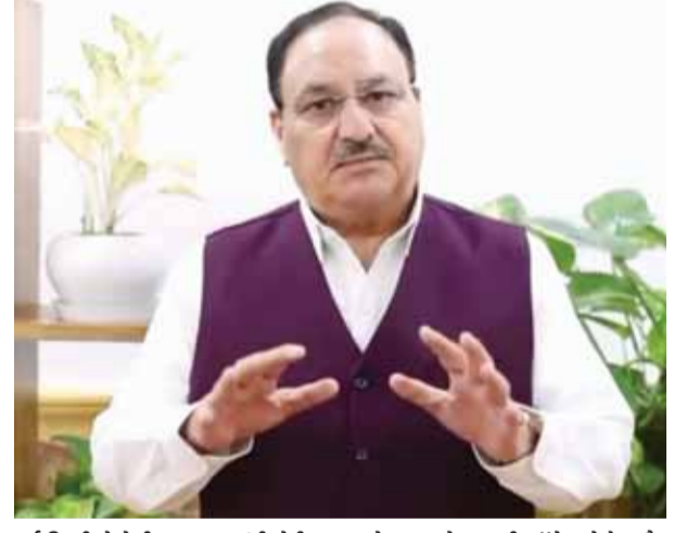
नई दिल्ली में केंद्रीय स्वास्थ्य मंत्री जेपी नड्डा कोलकाता के आरजी कॉलेज में रेप और हत्या मामले पर बयान देते हुए।

मात्राओं का उल्लंघन है। न्यायालय की अवमानना करना। प्रशासन ने एक कार्यालय ज्ञापन जारी कर सभी रेंजिडेंट डॉक्टरों का ध्यान उच्च न्यायालय द्वारा स्थापित आचार संहिता की ओर आकर्षित किया। इसमें आगे कहा गया कि व्यक्ति/छात्र/कर्मचारी/कर्मचारी के समूह द्वारा उच्च न्यायालय के आदेशों का उल्लंघन, छात्र/रेंजिडेंट डॉक्टर/एसोसिएशन/यूनियन आदि उच्च न्यायालय के निर्देशों का उल्लंघन करेगा और उन्हें अनुशासनात्मक कार्रवाई के साथ-साथ अदालत की अवमानना के लिए भी उत्तरदायी बनाया जाएगा। इसमें सभी एचओडी और केंद्र प्रमुखों को रेंजिडेंट डॉक्टरों की दोषार तीन बजे उपस्थिति प्रतिदिन भेजने के लिए (शेष पृष्ठ 9)