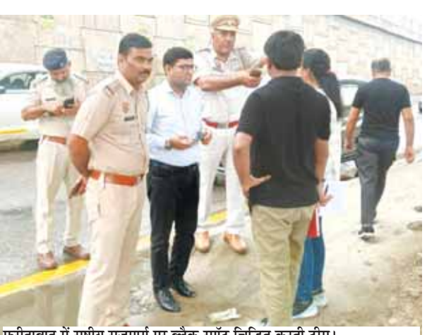
फरीदाबाद में राष्ट्रीय राजमार्ग पर ब्लैक स्पॉट चिन्हित करती टीम।