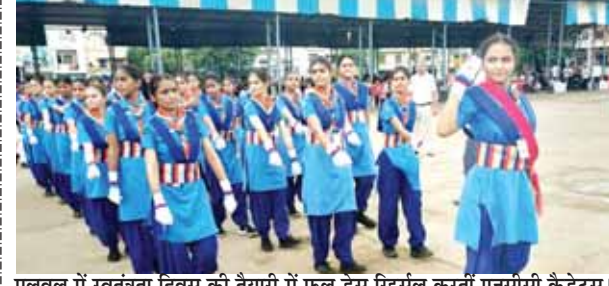
पलवल में स्वतंत्रता दिवस की तैयारी में फुल ड्रेस रिहर्सल करती एम्ससी के डेडेट्स।