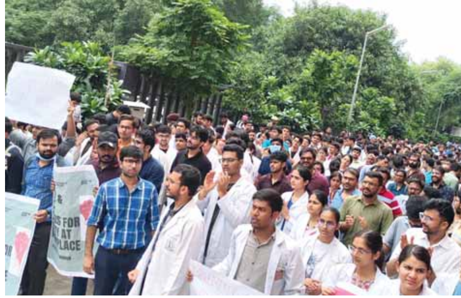
कोलकाता में डॉक्टर से रेप और हत्या के मामले में राजधानी में चिकित्सकों की हड़ताल दूसरे दिन भी जारी रही।

एम्स प्रशासन ने अस्पताल परिसर या उसके आस-पास प्रदर्शन करने के खिलाफ दी चेतावनी