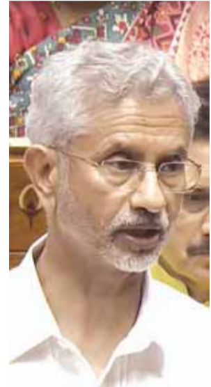
संसद में बोलते विदेश मंत्री एस. जयशंकर