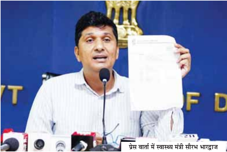
प्रेस वार्ता में स्वास्थ्य मंत्री सौरभ भारद्वाज

सौरभ भारद्वाज ने मंगलवार को संवाददाता सम्मेलन में कहा कि पिछले कई सालों (वर्ष 2017) से उच्च न्यायालय में स्वास्थ्य सेवाओं के संबंध में एक याचिका पर सुनवाई चल रही है, जिसमें हाई कोर्ट ने कहा था, कि जितने भी अलग-अलग अस्पताल हैं। उन सभी में आईसीयू बेड की उपलब्धता होनी चाहिए, मरीज के इलाज के लिए सभी सुविधाएं उपलब्ध होनी चाहिए। इस संबंध में हाईकोर्ट में कई बार स्वास्थ्य विभाग की ओर से कुछ हलफनामों दिए जा रहे थे। भारद्वाज ने कहा कि स्वास्थ्य मंत्री होने के नाते उन्होंने हाईकोर्ट में