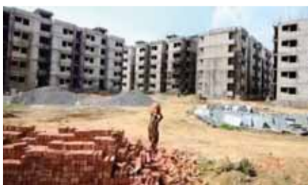
लोकनायकपुरम और नरेला जैसे विभिन्न इलाकों में उच्च आय वर्ग (एचआईजी), मध्यम आय वर्ग (एमआईजी), एलआईजी और ईडब्ल्यूएस सहित सभी श्रेणियों के फ्लैट बिना किसी मूल्य वृद्धि के 2023 की कीमतों पर पेश किए जाएंगे। फ्लैटों की शुरुआती कीमत लगभग 29 लाख रुपये है और इस योजना के तहत लगभग 5,400 फ्लैट पेश किए जाएंगे। डीडीए की द्वाराका आवास योजना ई-नीलामी प्रक्रिया के माध्यम से द्वाराका के सेक्टर 14, 16बी और 19बी में एमआईजी, एचआईजी और उच्च श्रेणी के फ्लैटों की पेशकश करेगी। इससे लोगों को द्वाराका के पॉश इलाके में अपना घर बनाने का मौका मिलेगा। योजना के तहत लगभग 173 फ्लैट पेश किए जा रहे हैं, जिनकी शुरुआती कीमत 128 लाख रुपये है। दिल्ली के निवासियों को जीवनयापन में आसानी प्रदान करने के लिए, प्राधिकरण ने सामुदायिक हॉल

दिल्ली विकास प्राधिकरण (डीडीए) जल्द ही तीन आवासीय योजनाएं लॉन्च करेगी, जिसके अंतर्गत शहर भर में अलग-अलग जगहों पर सभी आय वर्ग के लोगों के लिए फ्लैट उपलब्ध कराए जाएंगे। इस आवासीय परियोजनाओं को उपराज्यपाल विनय कुमार सक्सेना ने मंजूरी दे दी है। इसके अलावा सामुदायिक हॉल के प्रबंधन और उपयोग के लिए नई नीति और आवासीय, वाणिज्यिक, औद्योगिक और संस्थागत भूखंडों पर निर्माण पूरा करने के लिए समय बढ़ाने को भी मंजूरी दी गई है। राज निवास में मंगलवार को प्राधिकरण की बैठक में इस प्रस्ताव को मंजूरी दी गई। प्रस्तावों के अनुसार, डीडीए सस्ता घर आवास योजना 2024 में रामगढ़ कॉलोनी, सिरसपुर, लोकनायकपुरम, रोहिणी और नरेला में पहले आओ पहले पाओ (एफसीएफएस) के तहत रियायती दरों पर निम्न आय वर्ग (एलआईजी) और आर्थिक रूप से कमजोर वर्ग (ईडब्ल्यूएस) के फ्लैट उपलब्ध कराए जाएंगे, जिससे आवास अधिक सुलभ हो जाएगा और आम आदमी को दिल्ली में निम्न आय वर्ग के लिए घर मिल सकेगा। इस योजना के तहत करीब 34,000 फ्लैट उपलब्ध कराए जाएंगे, जिनकी शुरुआती कीमत करीब 11.5 लाख रुपये होगी। सामान्य आवास योजना के तहत, जसोला,