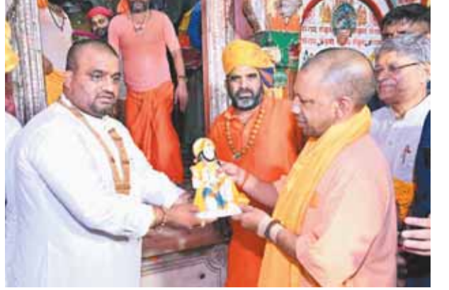
लखनऊ

मुख्यमंत्री योगी आदित्यनाथ मंगलवार को अयोध्या के दो दिवसीय दौरे पर पहुंचे। यहां महापौर, विधायक समेत जनप्रतिनिधियों व भाजपा नेताओं ने मुख्यमंत्री का स्वागत किया। मुख्यमंत्री मंगलवार शाम रामकथा पार्क पहुंचे। यहां से मुख्यमंत्री सीधे हनुमानगढ़ी पहुंचे, जहां संकटमोचन