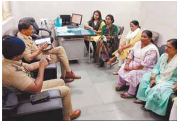
पायनियर समाचार सेवा। लखनऊ

लगभग 90 फीसदी खुलस चुकी इस महिला को इलाज हेतु लखनऊ मेडिकल कॉलेज के बर्न यूनिट में भर्ती कराया गया है। उत्तर प्रदेश महिला कांग्रेस अध्यक्ष ममता चौधरी के नेतृत्व में कांग्रेस का प्रतिनिधि मंडल पीड़िता का कुशलक्षेम जानने के लिए केजीएमयू गया। प्रतिनिधि मंडल के सदस्यों ने पीड़िता के परिजनों से मिलकर घटना की वस्तुस्थिति की जानकारी ली तथा परिजनों को हर संभव मदद का आश्वासन दिया साथ ही चिकित्सकों से मुलाकात कर समुचित इलाज का