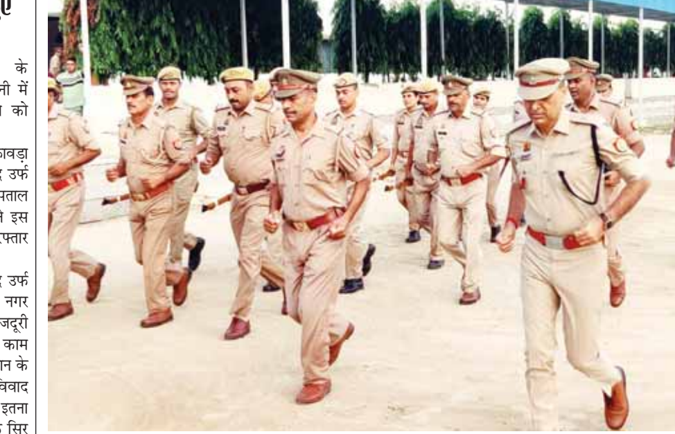
अतिरिक्त पुलिस उपायुक्त के निर्देश पर जवानों के शारीरिक व मानसिक स्वास्थ्य बनाये रखने के लिए ड्रिल करायी गई