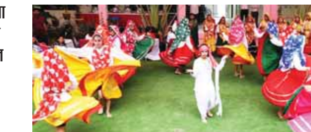
पायनियर समाचार सेवा। कुरुक्षेत्र

● महाराजा अग्रसेन शिक्षा सम्मान योजना परिवार के सदस्यों एवं अग्रवाल समाज ने किया आयोजन