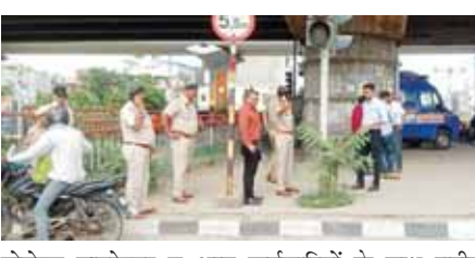
पायनियर समाचार सेवा। फरीदाबाद

● गुरुग्राम-फरीदाबाद रोड टोल के समी बेरिअर पॉइंट्स पर उपलब्ध होगी फास्ट टैग की सुविधा