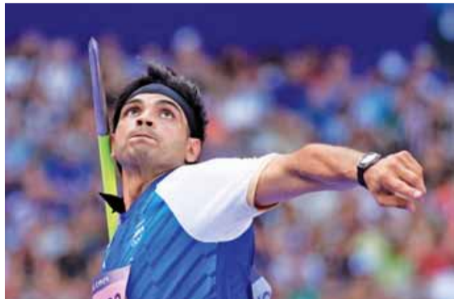
भारत के नीरज चोपड़ा पेरिस ओलंपिक में पुरुष भाला फेंक प्रतियोगिता में भाग लेते हुए