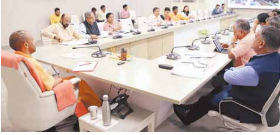
पायनियर समाचार सेवा। लखनऊ