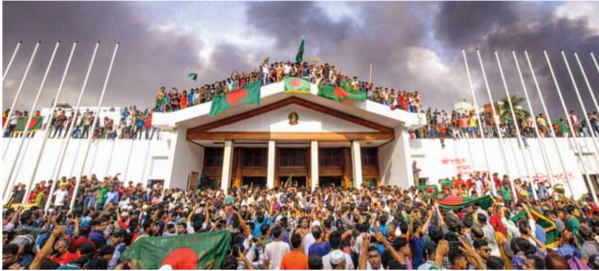
बांग्लादेश की राजधानी ढाका में प्रधानमंत्री आवास के आसपास भारी संख्या में जुटे लोग।