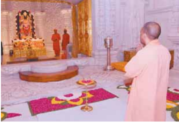
पायनियर समाचार सेवा। लखनऊ

मुख्यमंत्री योगी आदित्यनाथ मंगलवार को अयोध्या के दो दिवसीय दौरे पर पहुंचे। यहां महापौर, विधायक समेत जनप्रतिनिधियों व भाजपा नेताओं ने मुख्यमंत्री का स्वागत किया। मुख्यमंत्री मंगलवार शाम रामकथा पार्क पहुंचे। यहां से मुख्यमंत्री सीधे हनुमानगढ़ी पहुंचे, जहां संकटमोचन