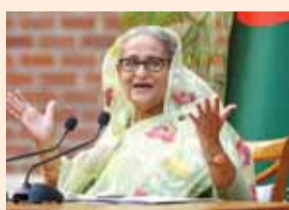
शेख हसीना के खिलाफ ब्रिटेन में कानूनी सुरक्षा नहीं मिल सकती है। ऐसे में हसीना की लंदन यात्रा की योजना कुछ अनिश्चितताओं (शेष पृष्ठ 9)

बांग्लादेश की पूर्व प्रधानमंत्री शेख हसीना के लंदन जाने की योजना कुछ अनिश्चितताओं के कारण अटक गई है और अगले कुछ दिनों तक उनके भारत से बाहर जाने की संभावना नहीं है। यह घटनाक्रम तब सामने आया जब ब्रिटेन सरकार ने संकेत दिया है कि उन्हें उनके देश में हिंसक प्रदर्शनों के मद्देनजर किसी भी संभावित जांच