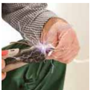
एक सप्ताह से अधिक समय तक अस्पताल में भर्ती रहने पर 25,000 रुपये और एक सप्ताह से कम समय तक अस्पताल में भर्ती रहने की स्थिति में 10,000 रुपये मिलेंगे, ऐसा नियम के तहत निर्धारित किया गया है। किसी भी बिजली से संबंधित दुर्घटना में किसी पशु के नुकसान के मामले में मुआवजे की मात्रा प्रत्येक दुधारू पशु-भैंस, गाय, ऊट (शेष पृष्ठ 9)

दिल्ली विद्युत विनियामक आयोग ने पहली बार विद्युत दुर्घटना पीड़ितों के लिए मुआवजा विनियम, 2024 जारी किया है, जिसके तहत शहर में बिजली से संबंधित दुर्घटनाओं के कारण मौत होने पर 7.5 लाख रुपये और 60 प्रतिशत से अधिक विकलांगता पर पांच लाख रुपये की वित्तीय सहायता का रास्ता साफ हो गया है। इस नियम के तहत मौत होने, लोगों के घायल होने के साथ-साथ दुधारू और भारवाहक पशुओं, पक्षियों और मुर्गियों के नुकसान के लिए मुआवजे की एक सीमा निर्धारित की गई है। यदि बिजली से संबंधित दुर्घटना में किसी व्यक्ति को 40-60 प्रतिशत चोट लगती है, तो उसे मुआवजे के रूप में एक लाख रुपये,