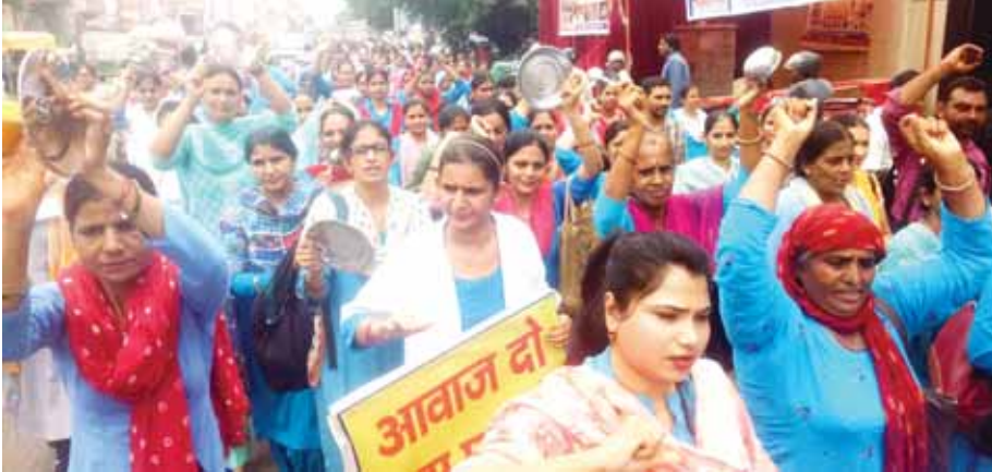
मंगलवार को गुरुग्राम की सड़कों पर अपनी मांगों को लेकर थाली बजाकर प्रदर्शन करते एनएचएम कर्मचारी।

● साझा मोर्चा के बैनर तले कर्मचारी 12 दिन से कर रहे हैं प्रदर्शन ● नियमित करने समेत कई मांगों को लेकर की जा रही हड़ताल