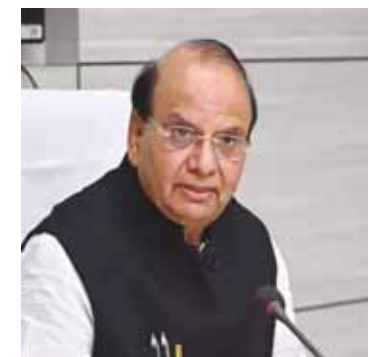
पायनियर समाचार सेवा। नई दिल्ली

(डीएसआईआईडीसी) संपत्ति आंकड़ों को एनजीडीआरएस के साथ एकीकृत करने का भी निर्देश दिया है ताकि ताकि संपत्ति पंजीकरण की प्रक्रिया निर्बाध, एकीकृत, पारदर्शी और नागरिक-अनुकूल सार्वजनिक सेवा वितरण सुनिश्चित किया जा सके। अधिकारियों ने विवरण देते हुए कहा कि एनजीडीआरएस जो नागरिकों को व्यापार करने और सेवा वितरण को बढ़ावा देने में प्रौद्योगिकी के उपयोग के साथ शहरी शासन में एक मील का पत्थर साबित होगा, पहले से ही 18 राज्यों और केंद्र शासित प्रदेशों में लागू किया गया, लेकिन दिल्ली इसे लागू करने में बहुत पीछे रह गयी। यह प्रणाली धीरे-धीरे राष्ट्रीय राजधानी में संपत्तियों के ऑनलाइन पंजीकरण का मार्ग प्रशस्त करेगी।