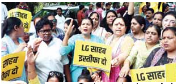
पायनियर समाचार सेवा। नई दिल्ली

● नाले में मां-बेटे की मौत पर उपराज्यपाल से मांगा इस्तीफा