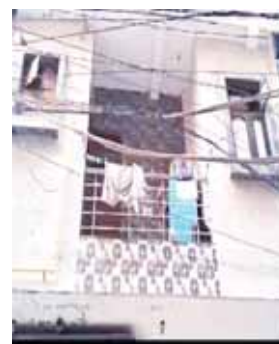
पायनियर समाचार सेवा। नई दिल्ली

● पूर्वी दिल्ली के न्यू अशोक नगर में दो हमलावरों ने वाददात को दिया अंजाम