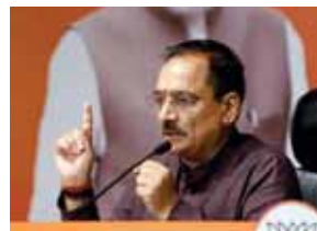
पायनियर समाचार सेवा। नई दिल्ली

● प्रदेश भाजपा अध्यक्ष ने कहा, विभाग की जिम्मेदारी लेने से इनकार करना दुखद