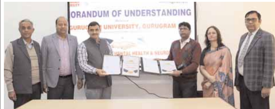
गुरुग्राम विश्वविद्यालय और विद्यासागर इंस्टीट्यूट ऑफ मेंटल हेल्थ एंड न्यूरो साइंसेज के बीच करार पर हस्ताक्षर के बाद फाइलों का आदान-प्रदान करते अधिकारी।

विमहांस के साथ एमओयू करने वाला हरियाणा का पहला विवि बना जीयू