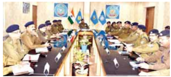
पीएनएस/ नई दिल्ली/मेरठ

● लोक व्यवस्था प्रबंधन में 15 दिनों तक प्राप्त करेंगे प्रशिक्षण