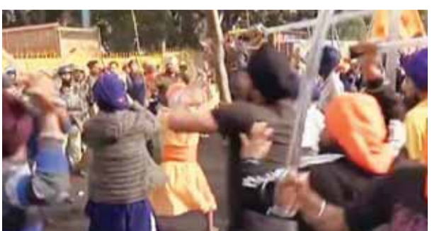
चंडीगढ़ में पुलिस से मिड़ते प्रदर्शनकारी। संजय कुमार मेहरा। चंडीगढ़

चंडीगढ़ में बुधवार को बंदी सिखों की रिहाई की मांग को लेकर सिख संगठन के प्रदर्शनकारियों और पुलिस के बीच भिड़ंत के बाद अफरा-तफरी मच गई। जहां पुलिस ने प्रदर्शनकारियों पर लाठीचार्ज किया वहीं सिख संगठन के सदस्यों ने पुलिस और निजी वाहनों को जमकर निशाना बनाया। दोनों पक्षों की तरफ