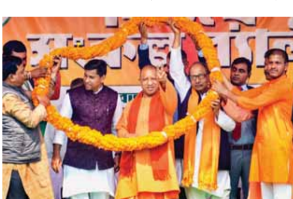
त्रिपुरा के गुनाखाट में एक चुनावी रैली में उप के मुख्यमंत्री योगी आदित्यनाथ

● चुनावी रैली में यूपी के मुख्यमंत्री ने कहा- डबल इंजन की सरकार ने बढ़ाई प्रगति की रफ्तार पायनियर समाचार सेवा। अगरतला, लखनऊ