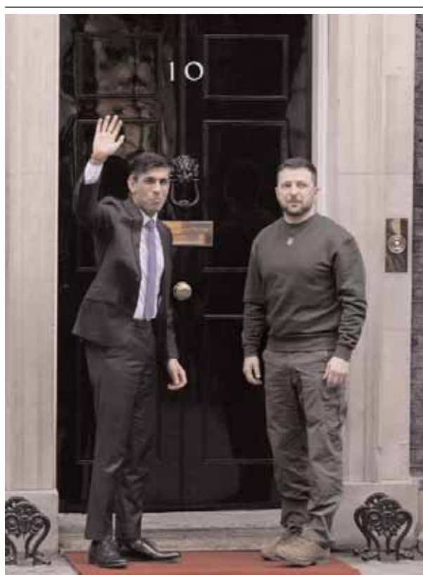
लंदन। डायनिंग स्टूट में बुधवार को यूक्रेन के राष्ट्रपति जेलेन्स्की का स्वागत करते ब्रिटेन के प्रधानमंत्री रूथि सुलका। लगभग एक साल पहले युद्ध शुरू होने के बाद से यूक्रेन के राष्ट्रपति की ब्रिटेन की यह पहली यात्रा है