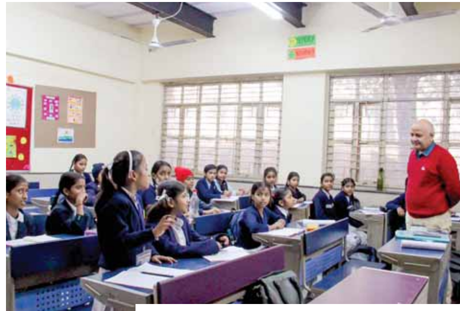
स्कूल में छात्र-छात्राओं से बातचीत करते शिक्षा मंत्री मनीष सिसोदिया।