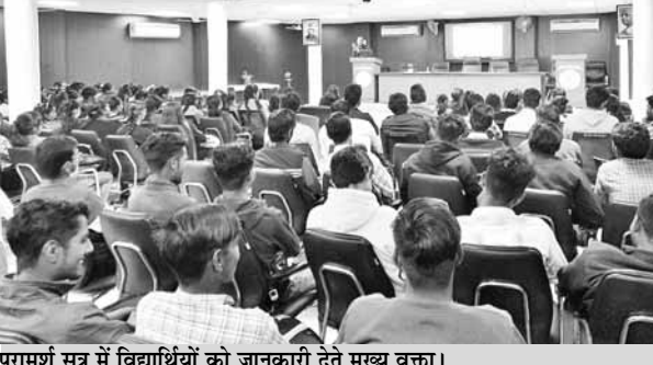
परामर्श सत्र में विद्यार्थियों को जानकारी देते मुख्य वक्ता।

कॉलेज में कैरियर परामर्श सत्र का किया आयोजन