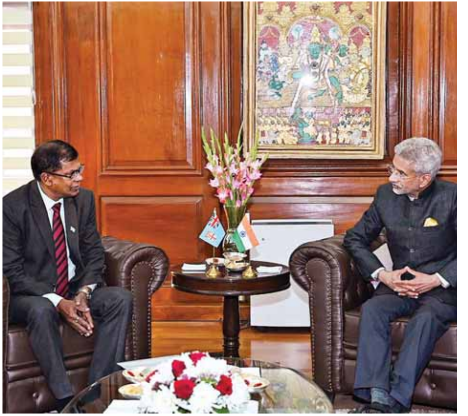
नई दिल्ली में विदेश मंत्री एस. जयशंकर के साथ बैठक करते फिजी के उपप्रधानमंत्री विगान प्रसाद।