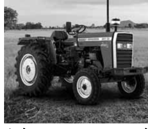
पायनियर समाचार सेवा । फरीदाबाद

कृषि में नए आईडियाज को सम्मानित और ग्रामीण उद्यमिता को प्रेरित करने के लिए