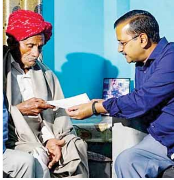
शहीद एसआई के परिवार को चेक सौंपते मुख्यमंत्री अरविंद केजरीवाल।

अदालत ने अस्पताल के स्वीचक्र रुख को संज्ञान में लिया और उसे निर्देश दिया कि वह गरीबों को मुफ्त इलाज मुहैया करे। पीठ ने कहा कि बयान को ध्यान में रखते हुए, अस्पताल को ओपीडी में 25 प्रतिशत और आईपीडी में 10 प्रतिशत तक ईडब्ल्यूएस रोगियों का मुफ्त इलाज करने का निर्देश दिया जाता है।