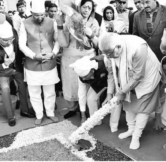
बन्दा बहादुर अस्पताल के लिए भूमिपूजन करते हुए मुख्यमंत्री मनोहर लाल

मुख्यमंत्री ने चैरिटेबल ट्रस्ट को 31 लाख रुपये देने की घोषणा की। परिवहन मंत्री मूलचंद शर्मा ने भी ट्रस्ट को 11 लाख रुपये देने की घोषणा की। मुख्यमंत्री ने कहा कि