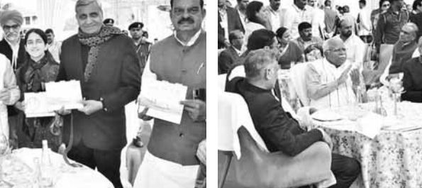
मेले में सांस्कृतिक कार्यक्रमों का लुफ उठाते मुख्यमंत्री मनोहर लाल।

इसके अलावा, बुधवार का दिन सूरजकुंड अंतरराष्ट्रीय हस्तशिल्प मेले के लिए और भी खास रहा। मुख्यमंत्री श्री मनोहर लाल ने पूरे मंत्रिमंडल व सभी विधायकों के साथ राजहंस होटल में दोपहर का भोजन किया। इस दौरान मेले में सांस्कृतिक महाकुंभ भी देखने को