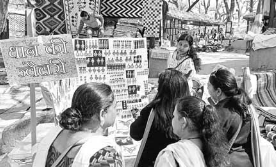
धान की ज्वैलरी के स्टॉल पर लगी भीड़।

कविता । फरीदाबाद आपने आज तक सोना, चांदी, हीरे और अन्य धातुओं से बने जेवरों के बारे में ही सुना होगा। लेकिन आपको यह जानकर हैरानी होगी कि धान से भी खूबसूरत जेवर बनाए जा सकते हैं। सूरजकुंड हस्तशिल्प मेले के स्टॉल नंबर 1072 से धान के जेवर आप खरीद सकते हैं। इस स्टॉल पर आपको 50 से 1000 रुपये तक की धान की ज्वैलरी मिल जाएगी।