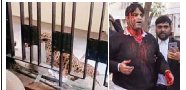
कोर्ट परिसर में धिल के गेट को बंद कर रोका गया तेंदुआ और हमले में घायल को ले जाते लोग पायनियर समाचार सेवा। गाजियाबाद

गाजियाबाद शहर के बीचों-बीच स्थित कोर्ट परिसर में बुधवार को तेंदुआ घुस गया और उसने दो वकील, एक पुलिसकर्मी, चार आम लोगों समेत 10 लोगों पर हमला कर दिया। इससे वे लहलुहान हो गए। रात में करीब आठ बजे तक भारी मशकत के बाद तेंदुआ को काबू कर लिया गया। वहां मौजूद हर व्यक्ति को जुबां पर यही सवाल था कि आखिर भीड़ भरे कोर्ट परिसर में आखिर तेंदुआ कहाँ से आ गया।