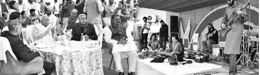
मेले में सांस्कृतिक कार्यक्रमों का लुफ उठाते मुख्यमंत्री मनोहर लाल।

मिला, जब विदेशी कलाकारों ने अपनी कला एवं संस्कृति का प्रदर्शन किया। अलग-अलग भाव, पहनावे, म्यूजिक तथा बोल सुना कर विदेशी कलाकारों ने दुनिया भर की सांस्कृतिक विविधताओं से माहौल को गुंजायमान कर दिया। सभी ने अपनी सांस्कृतिक