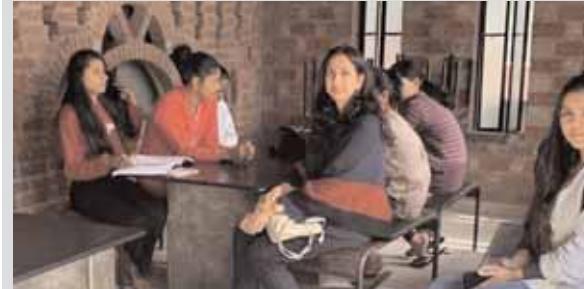
गुरुग्राम में बाल देखभाल संस्थान में पहुंचे स्कूल ऑफ बिजनेस के विद्यार्थी।

करुणाश्रय के तहत छात्रों ने बाल देखभाल संस्थानों का लिया जायजा