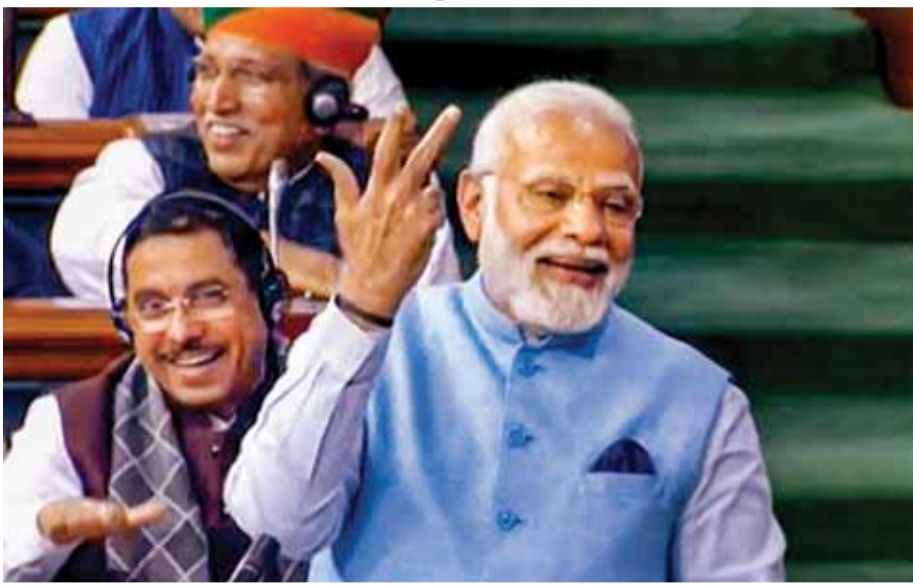
राष्ट्रपति के अभिभाषण पर लोकसभा में धन्यवाद प्रस्ताव पर हुई चर्चा का उत्तर देते प्रधानमंत्री नरेंद्र मोदी

● राहुल ने लगाया आरोप, पीएम कर रहे अडाणी का बचाव पायनियर समाचार सेवा। नई दिल्ली