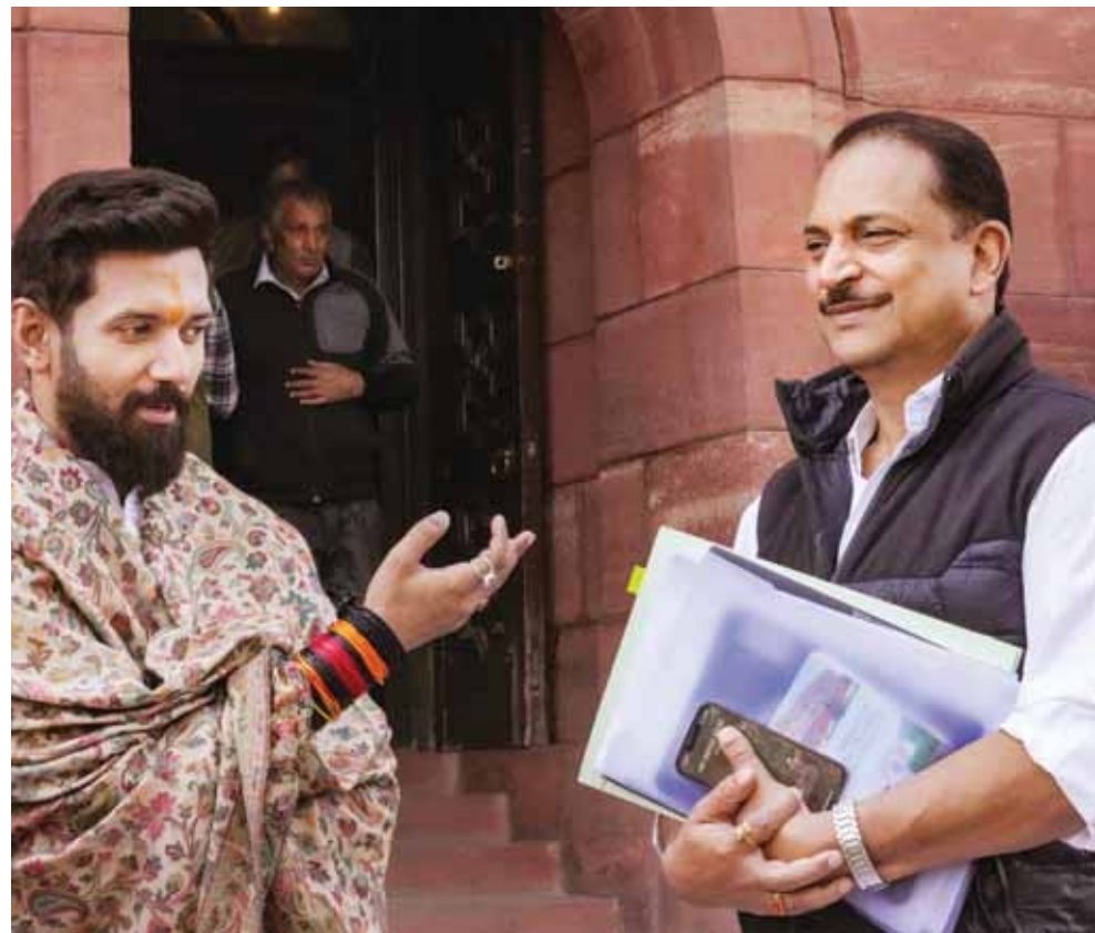
नई दिल्ली में भाजपा सांसद राजीव प्रताप रूडी। साथ में लोजपा (राम विलास) सांसद विराम पासवान बगट दर के दौरान संसद भवन में बात करते हुए

शोधार्थियों का कहना है कि इस अध्ययन का सबसे चौका देने वाला पहलू यह है कि भारत की आबादी के बड़े हिस्से को कोविड संक्रमण के लक्षण नहीं हुए और