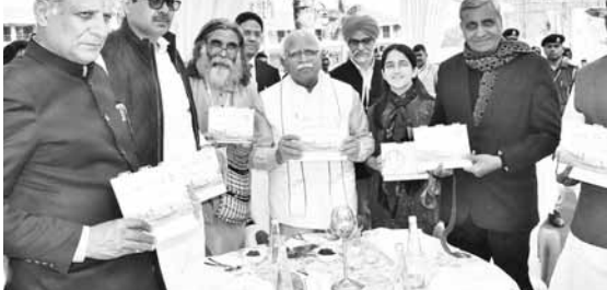
मेले में ब्रोशर लॉन्च करते मुख्यमंत्री मनोहर लाल।

हरियाणा के मुख्यमंत्री मनोहर लाल ने 36वें सूरजकुंड अंतरराष्ट्रीय हस्तशिल्प मेले में 'मिनिस्ट्री ऑफ डेवलपमेंट ऑफ नॉर्थ ईस्ट रीजन का इंटरनेशनल ईयर ऑफ मिलेट्स 2023 का ब्रोशर लॉन्च किया। उल्लेखनीय है कि संयुक्त राष्ट्र परिषद ने वर्ष 2023 को इंटरनेशनल ईयर ऑफ मिलेट्स 2023 घोषित किया है। प्रधानमंत्री श्री नरेंद्र मोदी भी विभिन्न अवसरों पर मोटे अनाज के प्रयोग करने का आह्वान कर रहे हैं। हरियाणा सरकार भी मिलेट्स को बढ़ावा देने के लिए अथक प्रयास कर रही है। सूरजकुंड अंतरराष्ट्रीय मेले में भी बाजरे से तैयार कई स्वादिष्ट व स्वास्थ्यवर्धक व्यंजन तैयार किए गए हैं।