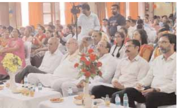
गुरुग्राम में आजादी के अमृत महोत्सव की श्रृंखला में समग्र शिक्षा अभियान की ओर से शिक्षक अभिवादन कार्यक्रम में उपस्थित अतिथि व शिक्षक।