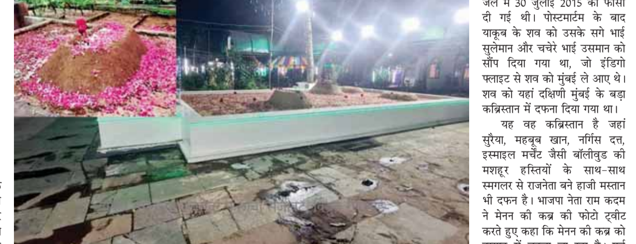
दक्षिण मुंबई में गरीब लाइंस के बड़ा कब्रिस्तान में स्थित 1993 के मुंबई बम धमाकों के दोषी याकूब मेमन की कब्र

मुंबई में 1993 के बम धमाकों के दोषी याकूब अब्दुल रजाक मेमन की कब्र के सौंदर्यीकरण को लेकर गुरुवार को राजनीतिक विवाद खड़ा हो गया है। मेमन को सात साल पहले फांसी दे दी गई थी। इसके बाद उसका शव दक्षिणी मुंबई के मेरिन लाइन स्थित बड़ा कब्रिस्तान में दफनाया गया था। आतंकी की कब्र को मजार में तब्दील किए जाने की सुगबुगाहट के बाद मुंबई पुलिस ने यहां की गई लाइटिंग