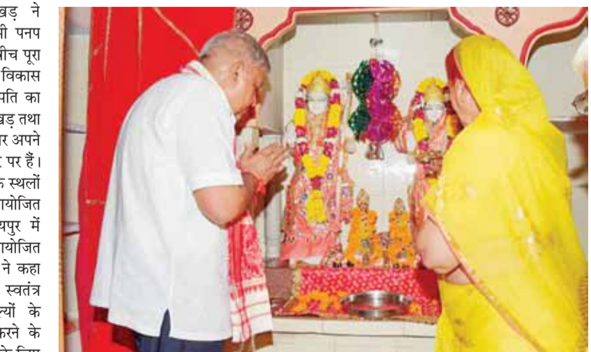
झुंझुनू जिले के आपने पेंतक गांव किराणा के जर्दिर में पूजा करते उपराष्ट्रपति

जयपुर। उपराष्ट्रपति जगदीप धनखड़ ने बुधस्पतिवार को कहा कि लोकतंत्र तभी पनप सकता है जब संवैधानिक संस्थाओं के बीच पूरा तादात्म्य हो। उन्होंने कहा कि आर्थिक विकास की जड़ें गांवों में हैं। भारत के उपराष्ट्रपति का पदभार ग्रहण करने के बाद जगदीप धनखड़ तथा उनकी पत्नी डॉ. सुदेश धनखड़ पहली बार अपने गृह राज्य राजस्थान की आधिकारिक दौरे पर हैं। अपने दौर के दौरान उन्होंने अनेक धार्मिक स्थलों के दर्शन किए तथा अपने सम्मान में आयोजित सम्मान समारोहों में भाग लिया। जयपुर में राजस्थान बार एसोसिएशन द्वारा आयोजित सम्मान समारोह में उपराष्ट्रपति धनखड़ ने कहा कि एक मजबूत, न्यायपूर्ण तथा स्वतंत्र न्यायपालिका, हमारे लोकतांत्रिक मूल्यों के संरक्षण और संवर्धन को सुनिश्चित करने के लिए जरूरी शर्त है। उन्होंने कहा कि इसके लिए बार की महत्वपूर्ण भूमिका होगी। धनखड़ ने कहा संस्थाओं में लोगों का भरोसा बनाए रखने के लिए, पारदर्शिता तथा जवाबदेही का कड़ाई से पालन किया जाना जरूरी है। उपराष्ट्रपति ने कहा कि लोकतंत्र तभी पनप सकता है जब संवैधानिक संस्थाओं के बीच पूरा तादात्म्य हो तथा वे अपनी-अपनी मर्यादा को सीमा में रहे। सम्मान समारोह में राजस्थान उच्च न्यायालय के कार्यकारी मुख्य न्यायाधीश एम