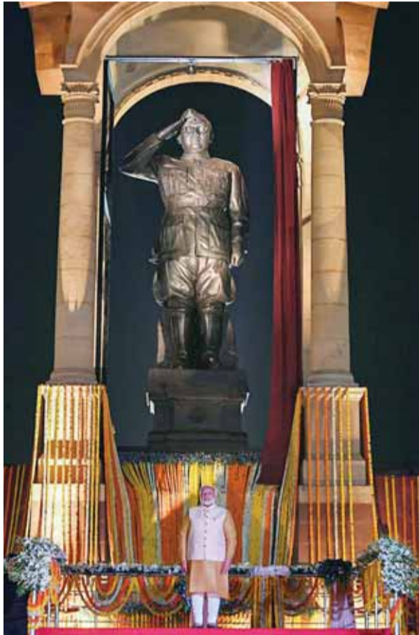
पुष्पांजलि अर्पित की और पारंपरिक बजाते हुए बोस की प्रतिमा का परिधानों में सजे कलाकारों द्वारा ढोल अनावरण किया। यहां प्रधानमंत्री का

विस्टा परियोजना का विरोध करते थे, वे दिल्ली में नए रक्षा कार्यालय परिसर के शुभारंभ पर सुविधाजनक रूप से चुप हो जाएंगे, जो कि सेंट्रल विस्टा का ही हिस्सा है। वे जानते हैं कि इससे उनकी कलाई खुल जाएगी। मोदी ने कहा कि डिफेंस एक्सेल्व राष्ट्रीय सुरक्षा में महत्वपूर्ण भूमिका निभाएगा। कर्तव्य पथ के दोनों किनारों पर नया विकसित क्षेत्र गोल चक्कर, इंडिया गेट, समेत बोस की काली ग्रेनाइट से बनी 28 फीट ऊंची प्रतिमा की मेजबानी करने वाली छतरी पूरी तरह रंगीन रोशनी में नहाई थी। इस पूरे क्षेत्र की लंबाई 1.8 किमी, चौड़ाई 12 मीटर और दोनों तरफ लाइल ग्रेनाइट फ्लूटाथ की चौड़ाई 4.2 मीटर है। प्रधानमंत्री मोदी ने कर्तव्य पथ का उद्घाटन करते हुए