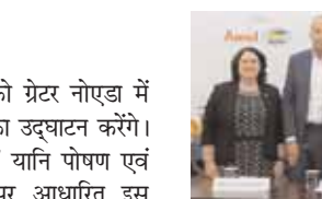
का आयोजन भी किया जाएगा। तीन दिनों तक चलने वाली ये बैठकें 9 सितम्बर से शुरू होंगी, बैठकों के दौरान भारत के 8 करोड़ से अधिक छोटे एवं सीमांत डेयरी किसानों (जिनके पास औसतन 2 मवेशी होते हैं) के योगदान पर चर्चा की जाएगी, जिन्होंने सालाना 210 एमटी उत्पादन के साथ भारत को दुनिया के अग्रणी दुग्ध उत्पादक के रूप में स्थापित किया है।

केन्द्रीय गृह एवं सहकारिता मंत्री अमित शाह तथा मछलीपालन, पशुपालन एवं डेयरी के लिए केन्द्रीय मंत्री परपोता रूपाला भी सम्मेलन को सम्बोधित करेंगे। 1974 में भारत द्वारा इंटरनेशनल डेयरी कॉन्ग्रेस का आयोजन के बाद पिछले 48 वर्षों से इस सम्मेलन का आयोजन किया जा रहा है। इंटरनेशनल डेयरी फेडरेशनल के अध्यक्ष पियरक्रिस्टियानो, आईडीएफ की महानिदेशक मिस कैरोलीन एमंड, आईडीएफ की भारतीय राष्ट्रीय समिति के सचिव एवं राष्ट्रीय डेयरी विकास बोर्ड के अध्यक्ष श्री मीनेश शाह भी सम्मेलन में मौजूद रहेंगे।