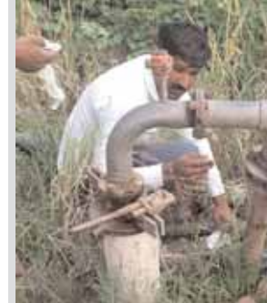
छपेमारी के दौरान अवैध बोर को सील करते सीएम उड़नदस्ता टीम के साथ छपेमारी का पटवारी।

सीएम उड़नदस्ता टीम ने अवैध बोरेवैल पकड़ा