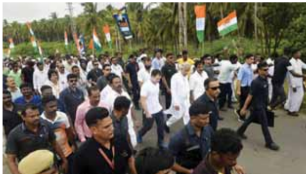
कन्याकुमारी में भारत जोड़ो यात्रा में कांग्रेस नेता राहुल गांधी

पूर्व कांग्रेस अध्यक्ष राहुल गांधी के नेतृत्व में महत्वाकांक्षी भारत जोड़ो यात्रा के दूसरे दिन कन्याकुमारी जिले के आगावतीसवयम से नागरकोइल के बीच विभिन्न क्षेत्रों से जुड़े लोगों ने इस यात्रा में शिरकत की। इस बीच, राहुल गांधी ने रास्ते में होटलों में भोजन करने और ठहरने से इनकार करते हुए वातानुकूलित कंटेनरों में ठहरने का फैसला किया है। दक्षिण के राज्य में पार्टी की महिला कार्यकर्ताओं से मिलने के साथ ही राहुल ने जवाहर लाल मंच पेंटिंग प्रतियोगिता के विजेताओं को पुरस्कृत किया। इसके बाद कोर्टटायम में दलित कार्यकर्ताओं और सिविल सोसाइटी के बीच चर्चा में भी उन्होंने भाग लिया। इसके पश्चात यात्री