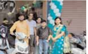
विधायक सुधीर सिंगला ने किया प्रधानमंत्री जन औषधि केंद्र का उद्घाटन