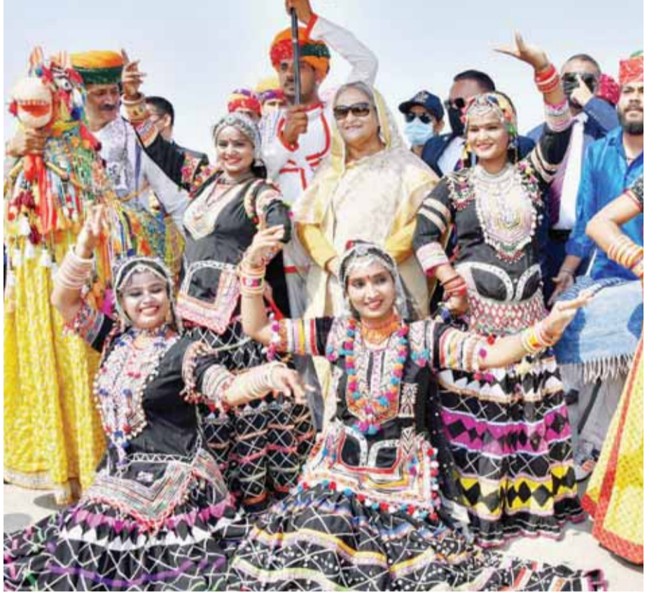
जयपुर हवाई अड्डे पर बांग्लादेश की प्रधानमंत्री शेख हसीना का स्वागत करते लोक कलाकार

उन्होंने इस बात पर जोर दिया कि इस क्षेत्र में सबसे उदार निवेश व्यवस्था बांग्लादेश में ही है। 100 विशेष आर्थिक क्षेत्र (एसईजेड) और 28 हाईटेक पार्क स्थापित किए जा रहे हैं जिन्हें उद्योग, गेजगर, उत्पादन और निर्यात को प्रोत्साहन मिलेगा। बांग्लादेश की प्रधानमंत्री ने कहा, मैं यहां पर मौजूद करोबारी घरानों से वहां निवेश करने का अनुरोध करूंगी। इससे दोस्ताना रिस्ते बढ़ने दोनो देशों के बीच सद्भावना बढ़ाने और इस क्षेत्र में आर्थिक समृद्धि लाने का रास्ता तैयार होगा।