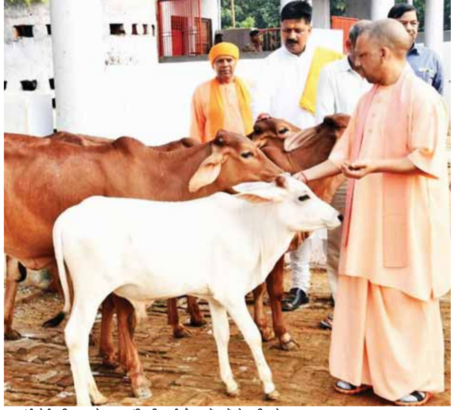
मुख्यमंत्री योगी आदित्यनाथ गोरखनाथ मंदिर परिसर की गोशाला में गायों को गूड़ खिलाते हुए

मुख्यमंत्री ने कहा कि हम इतिहास को विस्मृत कर उज्वल भविष्य की कल्पना नहीं कर सकते। विकास केवल बोल देने से नहीं होगा बल्कि इसमें सबको भूमिका होनी चाहिए। इतिहास, ज्ञान, विज्ञान के समन्वय से ही विकास का मार्ग प्रशस्त होगा। उन्होंने कहा कि जिन महापुरुषों ने आजादी के लिए अपना सर्वस्व न्यौछावर कर दिया और गुमनाम रह गए उन्हें ढूँढना और उनके जरिए वर्तमान एवं भवित्तीय को प्रेरणा देने का दायित्व शिक्षण संस्थाओं को उठाना होगा। इसी क्रम में राष्ट्रीय शिक्षा नीति के संकल्पों से जुड़कर शिक्षण संस्थान खुद को आदर्श केंद्र बना सकते हैं। शिक्षण संस्थाएं पाठ्यक्रमों के साथ सरकार की योजनाओं की गहरी जानकारी रखें ताकि अध्ययन के बाद छात्र को कहीं भटकना पड़े।