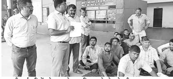
हड़ताली कर्मचारियों को समझाते हुए हरियाणा रोडवेज के जीएम।