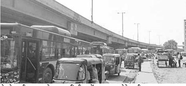
रोडवेज की हड़ताल के कारण निजी बसों का सहारा लेते यात्री।