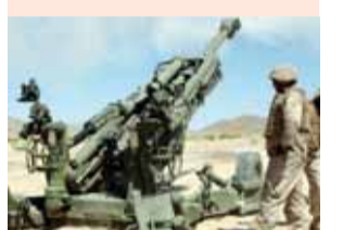
पायनियर समाचार सेवा। नामसई (अरुणाचल प्रदेश)

एलएसी पर अरुणाचल में तैनात की गईं एम 777 हॉलिवर्जर तोपें