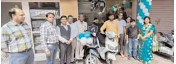
गुरुग्राम में ई-वाहनों के शोरूम का उद्घाटन करते अतिथि।