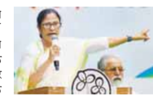
(टीएमसी ने) भाजपा को हराकर लगातार तीसरी बार सत्ता में वापसी की थी। बनर्जी ने दावा किया कि हाल ही में बंगाल पुलिस ने झारखंड के विधायकों को बहुत अधिक नकदी के साथ गिरफ्तार करने पड़ोसी राज्य में खरीद-फरोख्त को रोका और हेमंत सोरेन सरकार को गिरने से बचाया।

उन्होंने कहा, मैं, नीतीश कुमार, हेमंत सोरेन और कई अन्य लोग 2024 में एक साथ आएं। सभी विपक्षी दल भाजपा को हराने के लिए हाथ मिलाएंगे। एक तरफ हम सब होंगे और दूसरी तरफ भाजपा। भाजपा को 300 सीटों के अहंकार का दंड मिलेगा। 2024 में खेला होवे। खेला होवे (खेल जाये है) पिछले साल विधानसभा चुनावों के दौरान टीएमसी का सशक्त नाथ था, जिसमें उसने