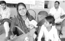
बस के इंतजार में बल्लभगढ़ बस अड्डे पर बैठे यात्री।