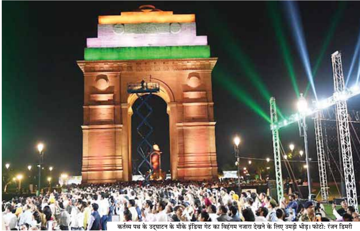
कर्तव्य पथ के उद्घाटन के मौके इंडिया गेट का विहंगम नजारा देखने के लिए उमड़ी भीड़।

बेकर ने राष्ट्रपति भवन के पास एक गोलाकार संसद भवन बनाया जिसका उद्घाटन जनवरी 1927 में तत्कालीन वायसराय लॉर्ड इरविन ने किया था। दो विश्व युद्धों के बीच शहर का निर्माण किया गया था और