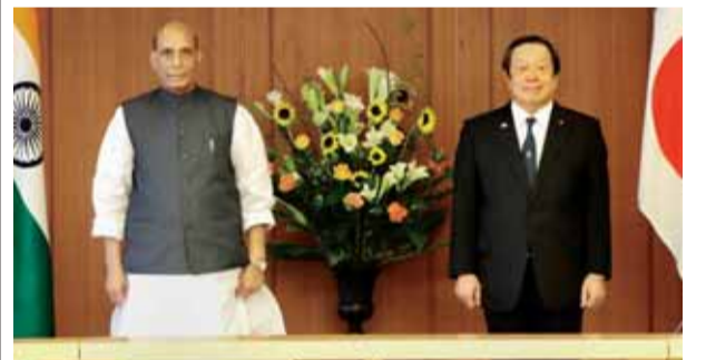
टोक्यो में जापानी समकक्ष यासुकाजु इनटा के साथ रक्षा मंत्री राजनाथ सिंह