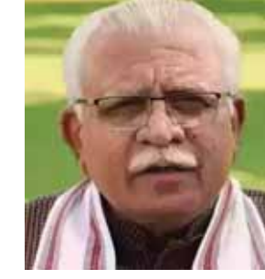
मनोहर लाल खट्टर

भारतीय जनता पार्टी (भाजपा) के वरिष्ठ नेता मनोहर लाल खट्टर ने सोमवार को दिल्ली के मुख्यमंत्री अरविंद केजरीवाल पर जेल में बंद आम आदमी पार्टी (आप) नेता सत्येंद्र जैन को मंत्रिमंडल से नहीं हटाने को लेकर निशाना साधते हुए कहा कि अगर वह ऐसा नहीं करते हैं तो