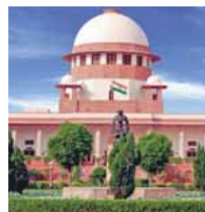
सरकार द्वारा मंजूरी नहीं दी जा रही है।

उच्चतम न्यायालय ने शीर्ष अदालत में न्यायाधीशों की नियुक्ति के लिए कॉलेजियम की ओर से अनुशंसित नामों को मंजूरी देने में केंद्र की देरी पर नाराजगी जताते हुए कहा कि यह नियुक्ति के तरीके को प्रभावित करने के लिए किया गया है। न्यायमूर्ति एस के कौल और न्यायमूर्ति ए एस ओका की पीठ ने कहा कि शीर्ष अदालत की तीन न्यायाधीशों की पीठ ने नियुक्ति प्रक्रिया पूरी करने के लिए समय सीमा निर्धारित की थी। पीठ ने कहा कि उस समय सीमा का पालन करना होगा।