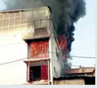
आग का दृश्य

नई दिल्ली। उत्तर पश्चिमी दिल्ली के केशव पुरम इलाके में जूता बनाने के एक कारखाने में सोमवार को भीषण आग लग गई। अधिकारियों ने यह जानकारी दी। अग्निशमन विभाग के अधिकारियों के मुताबिक, आग लगने की सूचना दोपहर 12 बजकर करीब 25 मिनट पर मिली और दमकल की 27 गाड़ियां मौके पर भेजी गईं। उन्होंने कहा कि केशव पुरम औद्योगिक क्षेत्र में सी-46 लॉरेन्स रोड पर हुई इस घटना में अभी तक किसी के हाताहत होने की खबर नहीं है।