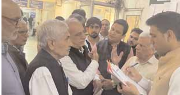
सोनी टीवी के विरोध में डीसी को ज्ञापन सौंपते जाट स्वाभिमान समिति गुडगांव के सदस्य।