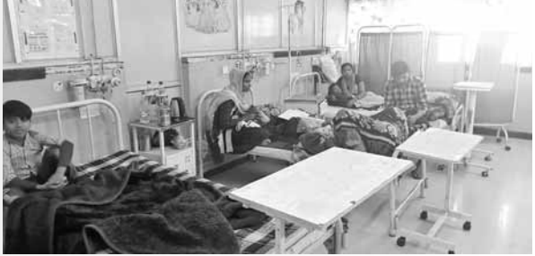
बीके अस्पताल के बच्चा वार्ड में भर्ती बच्चे।

पिछले कुछ दिनों से बढ़ रही सर्दी नौनिहालों के लिए घातक साबित हो रही है। जिसके कारण बच्चों की निमोनिया जैसी बीमारी अपनी चपेट में ले रही है। जिससे न सिर्फ शहर के सरकारी अस्पताल बल्कि निजी अस्पतालों में भी निमोनिया के मरीजों की संख्या बढ़ रही है। बादशाह खान अस्पताल के शिशु रोग वार्ड और अपातकालीन कक्ष में निमोनिया के आधा दर्जन से अधिक