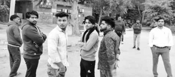
बीके अस्पताल की मोरची के बाहर खड़े शेका कुल मृतक के परिजन।

बल्लभगढ़ के गांव कौराली से जुहैड़ा की ओर जाने वाले रास्ते से पुलिस ने सोमवार सुबह लक्ष्मी की सूचना पर एक व्यक्ति का अधजला शव बरामद किया है। पुलिस ने शव को कब्जे में लेकर उसकी शिनाख्त करने के प्रयास शुरू कर दिये। उसी दौरान कौराली गांव निवासी एक युवक ने मौके पर पहुंच कर शव की पहचान अपने पिता के रूप में कर दी। मृतक व्यक्ति आइएमटी इलाके में परचून की दुकान चलाता था। बीती रात दुकान बंद करने के बाद के बाद मृतक अपने घर लौट रहा था। उसी दौरान अज्ञात लोगों ने उनकी हत्या करने के बाद मृतक की पहचान