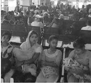
ओपीडी में बीमारियों से ग्रस्त बच्चों को गोद में लेकर बैठी महिलाएं।

पांच वर्ष से कम उम्र के ज्यादातर बच्चों को निमोनिया होने पर उन्हें सांस लेने में कठिनाई होती है। रोजाना करीब 50-60 मरीज