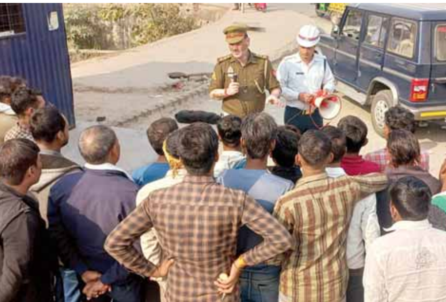
छिजारीस कट सेक्टर-63 पर ऑटो, टॉपे व ई रिक्शा चालकों को यातायात नियमों के प्रति जागरूक किया गया।

अंतिम अवसर भी दिया गया, लेकिन संस्था ने प्रीमियम या फिर लीज रेंट के रूप में कोई भुगतान नहीं किया, जिसके चलते संस्था का आवंटन निरस्त कर दिया गया है। वहीं, प्राधिकरण के संस्थान विभाग ने ही ग्रेटर नोएडा प्राधिकरण ने ग्रेटर नोएडा एजुकेशनल इंस्टीट्यूट बनाने के लिए सोहो फूड एंड बेवरेजेस सोहो मास्कोट फाउंडेशन को 2014 में भूखंड संख्या.07, सेक्टर टेकजोन.7 में 20 हजार वर्ग मीटर का भूखंड आवंटन भी निरस्त कर दिया है। इस संस्था पर करीब 20.08 करोड़ रुपये प्रीमियम और करीब 4.83 करोड़ रुपये लीज रेंट बकाया हो चुका था। नौ किस्तें बकाया हो चुकी थीं। इस दौरान संस्था को कई बार डिफॉल्टर नोटिस और फिर कैंसिलेशन नोटिस जारी की गई, लेकिन कोई जवाब नहीं दिया गया, जिसके चलते संस्था आवंटन निरस्त कर दिया गया है।