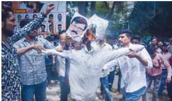
राज्य में संजय राउत के विरुद्ध प्रदर्शन करते शिंदे गुट के समर्थक शिवसेना कार्यकर्ता

सुप्रीम कोर्ट ने महाराष्ट्र विधानसभा के उपाध्यक्ष द्वारा जारी अयोग्यता नोटिस के खिलाफ शिवसेना के बागी विधायकों को राहत प्रदान करते हुए सोमवार को कहा कि संबंधित विधायकों की अयोग्यता पर 11 जुलाई तक फैसला नहीं लिया जाना चाहिए। अदालत ने अयोग्यता नोटिस की वैधानिकता को चुनौती देने वाले बागी विधायकों की याचिकाओं पर जवाब मांगा है। इसके साथ ही महाराष्ट्र सरकार को शिवसेना के सभी बागी विधायकों और उनके परिवार की सुरक्षा करने का निर्देश भी दिया। हालांकि, शीर्ष अदालत ने महाराष्ट्र सरकार को उस याचिका पर अंतरिम आदेश पारित करने से इनकार कर दिया, जिसमें विधानसभा में बहुमत