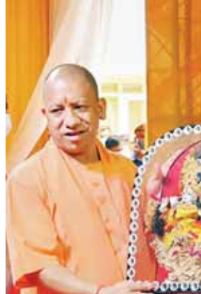
वृंदावन के आश्रय सदन में राष्ट्रपति रामनाथ कोविंद का स्वागत करते मुख्यमंत्री योगी आदित्यनाथ

राष्ट्रपति रामनाथ कोविंद ने विधवा महिलाओं के प्रति समाज में व्याप्त कुप्रथाओं का जिक्र करते हुए सोमवार को कहा कि वह एक ऐसे समाज की कल्पना करते हैं, जिसमें विधवा और निराश्रित महिला आश्रय सदनों का निर्माण करने की जरूरत न पड़े। कोविंद ने अपनी वृंदावन यात्रा के दौरान केंद्र सरकार के सहयोग से विधवा एवं निराश्रित महिलाओं के पुनर्वास के लिए निर्मित कृष्णा कुटीर आश्रय सदन में आयोजित कार्यक्रम में कहा कि हमारा समाज सदियों से चली आ रही कुप्रथाओं को दूरिकार कर विधवा, परित्यक्त एवं निराश्रित महिलाओं को इस प्रकार स्वीकार करे कि उन्हें फिर किसी अन्य स्थान पर जाकर किसी के आश्रय में न रहना पड़े और वे परिवार के अन्य सदस्यों की तरह ही उनके साथ मिल-जुलकर रहें। राष्ट्रपति वृंदावन में कृष्णा कुटीर आश्रय सदन में प्रवास कर रही विधवा एवं निराश्रित महिलाओं के बारे में