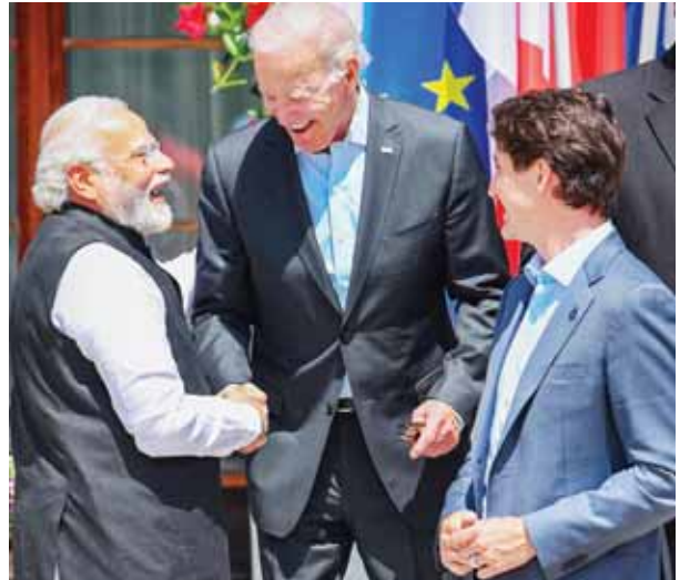
जर्मनी के इलमाउ में जी-7 शिखर सम्मेलन में अमेरिकी राष्ट्रपति जो बाइडन और कनाडा के प्रधानमंत्री जस्टिन टूडो के साथ प्रधानमंत्री नरेन्द्र मोदी

समूह फोटो सत्र से पहले, राष्ट्रपति बाइडन प्रधानमंत्री मोदी की ओर चले गए और उन्होंने एक-दूसरे का अभिवादन किया और गर्मजोशी से हाथ मिलाया। समूह फोटो के लिए कनाडा के अपने समकक्ष टूडो के बगल में खड़े प्रधानमंत्री मोदी को भी कनाडा के प्रधानमंत्री के साथ बातचीत करते देखा गया। दोनों नेताओं का आज शाम को द्विपक्षीय बैठक करने का कार्यक्रम है। मोदी और मैक्रों आपस में गले मिले और समूह फोटो के बाद बातचीत की। जैसे ही जी-7 के नेता शिखर सम्मेलन स्थल के अंदर गए, दोनों नेताओं ने अपनी चर्चा जारी रखी और एक साथ अंदर चले गए। प्रधानमंत्री कार्यालय ने ट्विटर पर कहा,