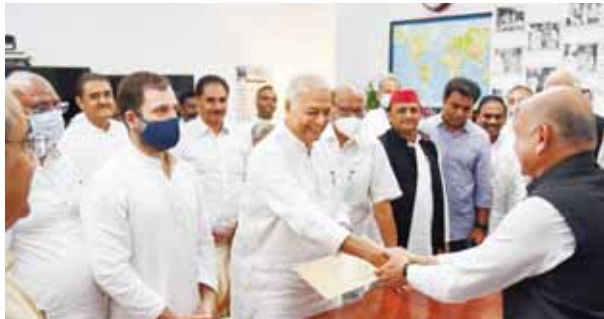
नई दिल्ली में विपक्षी नेताओं के साथ राष्ट्रपति पद के लिए नामांकन पत्र दाखिल करते यशवंत सिन्हा