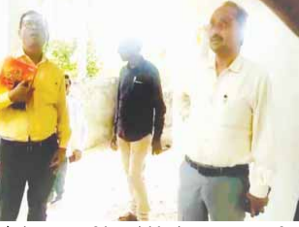
खड़ौवा में पंचायत भवन का निरीक्षण करते डीसी मनरेगा

● कहा -अभी तक हमने ऐसा फर्जीवाड़ा नहीं देखा, मची हुई है धन की लूट