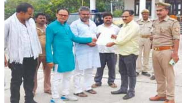
ज्ञापन लेते तहसीलदार

● तहसीलदार ने लिया ज्ञापन ● अग्निपथ योजना के विरोध में आज कांग्रेसियों का था प्रदर्शन