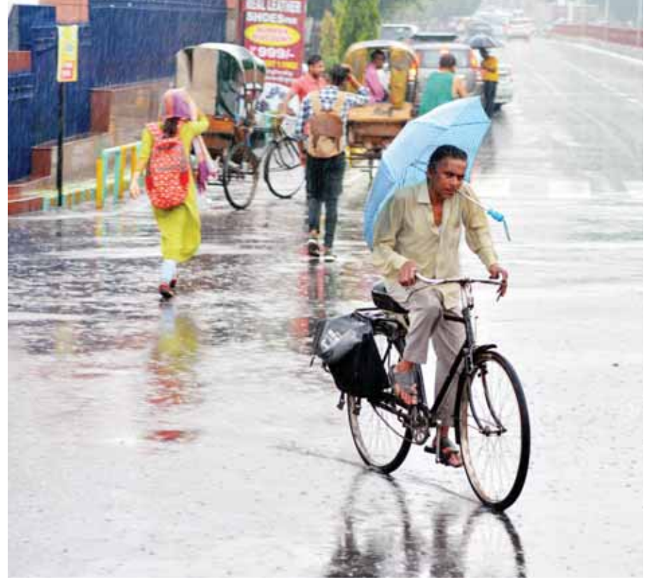
राजधानी में हुई बारिश से कुछ समय के लिए माहौल हुआ सुखानुग, उनस ने बाद में लोगों को किया बेहाल।