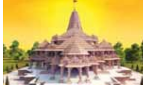
निर्माणाधीन श्रीराम मंदिर का गोंडल