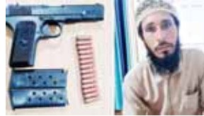
झोडा में पकड़ा गया आतंकी और बरामद हथियार

जम्मू कश्मीर के कुलगाम जिले में सोमवार को सुरक्षा बलों के साथ मुठभेड़ में दो अज्ञात आतंकवादी मारे गए। पुलिस के एक अधिकारी ने बताया कि सुरक्षा बलों ने आतंकवादियों की मौजूदगी की सूचना मिलने के बाद जिले के नुबजो इलाके में नौपु-खेरपुर में घेरावती कर तलाश अभियान शुरू किया था। उन्होंने बताया कि तलाशी अभियान मुठभेड़ में तब्दील हो गया, जिसमें दो आतंकवादी मारे गए। अधिकारी ने बताया कि मारे गए आतंकवादियों की पहचान करने की कोशिश की जा रही है और यह पता लगाया जा रहा है कि वे किस आतंकवादी संगठन से जुड़े थे। उन्होंने कहा कि अंतिम सूचना मिलने तक अभियान जारी था। वहीं जम्मू जिले में