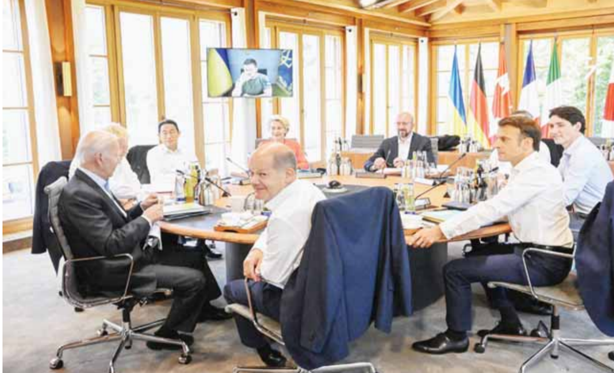
जर्मनी में जी-7 की बैठक में भाग लेते जी-7 देशों के राष्ट्राध्यक्ष

तुर्की और सऊदी अरब जैसे देशों से संपर्क करेगा। वह अमेरिका, ब्रिटेन और जी20 के अन्य सदस्यों से भी बात करेगा।