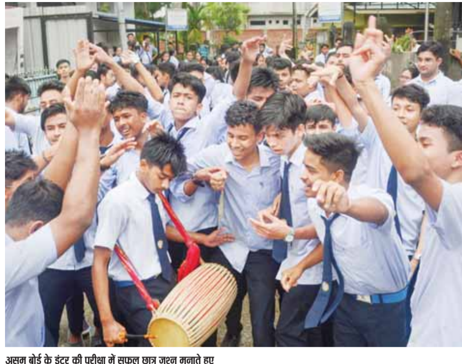
असम बोर्ड के इंटर की परीक्षा में सफल छात्र जश्न मनाते हुए