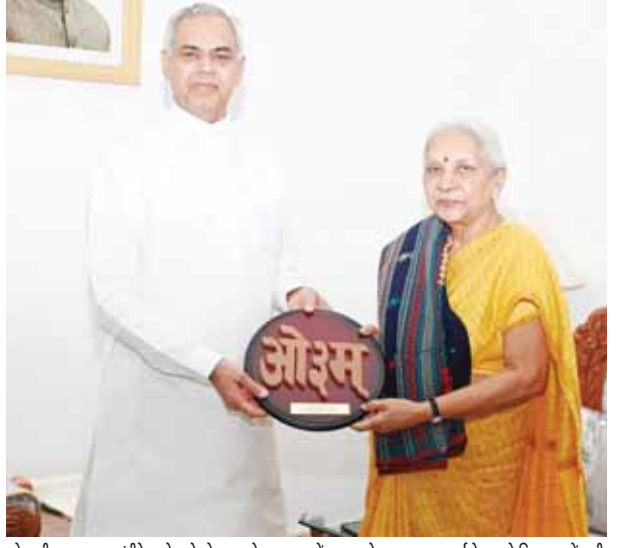
प्रदेश की राज्यपाल आनंदीबेन पटेल से सोमवार को राज्यपाल ने कुलदेव के राज्यपाल आचार्य देववर्त ने दिग्दर्शन के बाद

लखनऊ। कोरोना के तेजी से बढ़ते मामलों के बीच प्रदेश सरकार के उप मुख्यमंत्री बृजेश पाठक ने सोमवार को प्रदेश में टीकाकरण के लेकर बड़ा दावा किया है। उन्होंने कहा है कि यूपी में वयस्कों के कोरोना टीकाकरण का काम 100 फीसदी पूरा हो गया है। जो कि एक बड़ी उपलब्धि है। डिप्टी सीएम ने कहा कि प्रधानमंत्री नरेंद्र मोदी के निर्देश पर प्रदेश में शत-प्रतिशत टीकाकरण हो चुका है और अब हम तेजी से बच्चों का टीकाकरण कर रहे हैं। बता दें कि देश में वैक्सिनेशन के मामले में उत्तर प्रदेश पहले नंबर पर है। यहां 14,25,40,966 करोड़ लोगों को वैक्सिनेशन की दोनो डोज लगाई जा चुकी है। वहीं 35,26,740 लोगों को प्रिक्वॉशन डोज भी दी जा चुकी है। प्रदेश में अब 15-17 साल के बच्चों को भी वैक्सिनेशन की डोज तेजी से लगाई जा रही है।