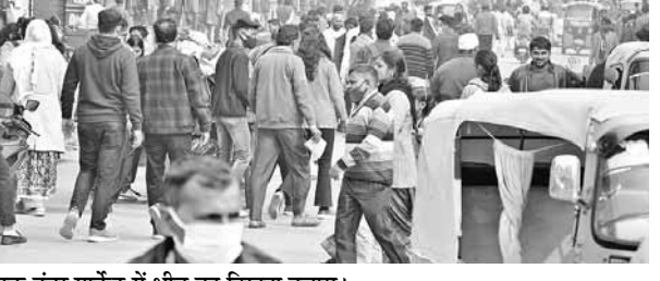
एक नंबर मार्केट में भीड़ का दिखता नजारा।