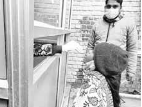
कोरोना की जांच करवाती एक युवती। कोरोना: बनाए पांच नए कंटेनमेंट जोन

जिसमें 9 कैदी भर्ती हैं। वहीं मंगलवार को 1015 नए मामले सामने आए। जिस कारण जिले में एक्टिव केसों की संख्या का आंकड़ा 4766 पर पहुंच गया है। जिसमें 92 मरीज अस्पताल में हैं, इनमें से 26 वैक्सिनेशन पर और पांच मरीजों को वेंटीलेटर पर भर्ती किया गया है। वहीं राहत की बात यह रही कि जिले में 148 रोगियों ने कोरोना की जंग जीत ली। जिससे जिले का रिकवरी रेट 94.79 प्रतिशत पर पहुंच गया। वहीं कर्तव्य सैम्पल पॉजिटिविटी रेट 19.60 प्रतिशत है। कोरोना के बढ़ते मामलों को देखते हुए वैक्सिनेशन और कोरोना जांच को बढ़ावा दिया गया है। जिसके तहत पिछले 24 घंटे में 5178 सैम्पल जांच किए गए हैं। लेकिन सरकारी में 3917 और निजी में 1482 सैम्पलों की रिपोर्ट आनी बाकी है। जिससे लोग परेशान हो रहे हैं।