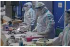
पायनियर समाचार सेवा। नई दिल्ली

● एलएनजेपी के 136 कोविड मरीजों में 130 थे दूसरी बीमारियों से पीड़ित