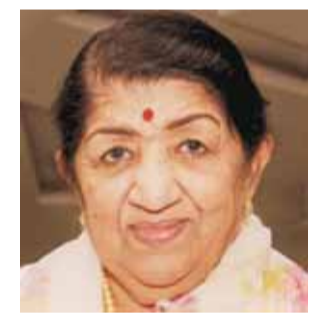
लता मंगेशकर की फाइल फोटो

उनकी उम्र को ध्यान में रखते हुए, चिकित्सकों ने सलाह दी है कि उन्हें निरंतर देखभाल की जरूरत है। स्थिति में प्रतिबंधित उपयोग के लिए 28 दिसंबर को भारत के औषधि नियामक से मंजूरी मिल गई थी। इस संबंध में एक आधिकारिक सूत्र ने पीटीआई-भाषा से कहा, कोविड-19 संबंधी राष्ट्रीय कार्यबल के सदस्य इस दवा को राष्ट्रीय उपचार दिशानिर्देशों में शामिल करने (शेष पेज 9)