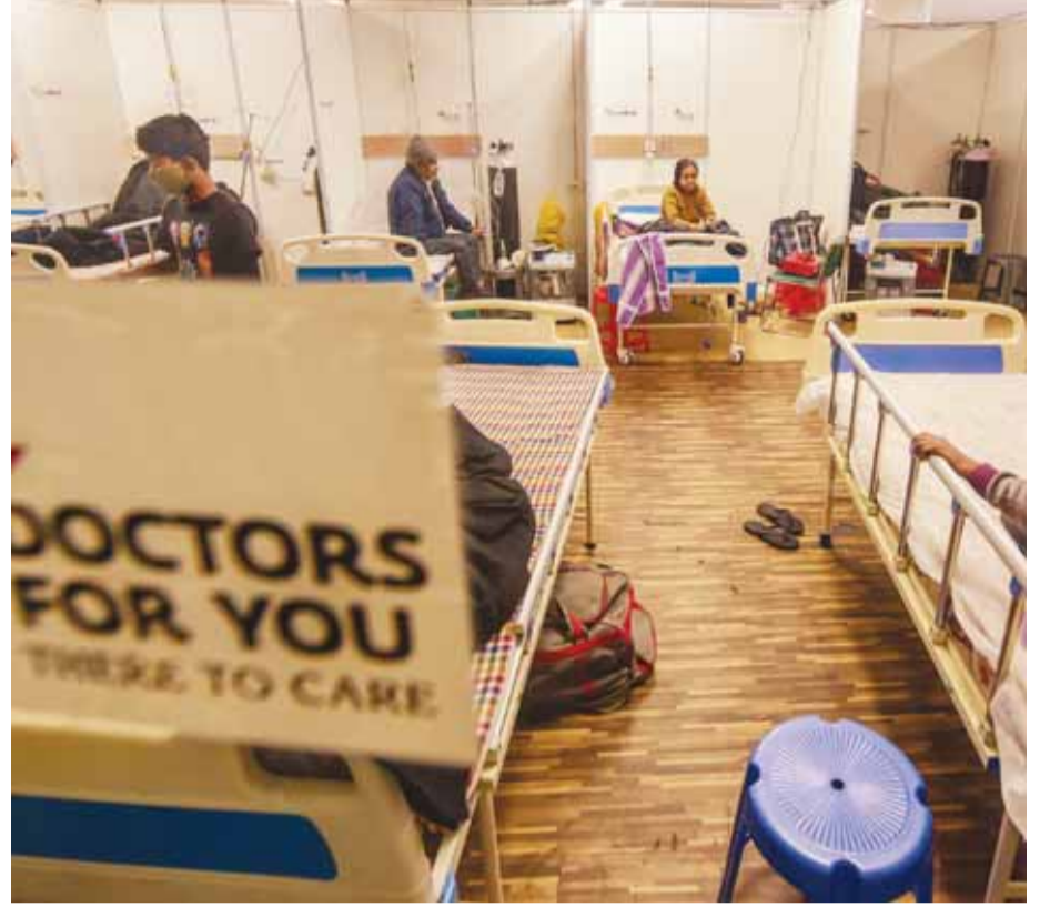
नई दिल्ली में कोविड-19 से प्रभावित बच्चे कोविड केयर सेंटर में एडमिट।

नागरिकों की पीढ़ी दर पीढ़ी गुजर जाती है, लेकिन न्याय नसीब नहीं हो पा रहा है। सरकारी आंकड़ों के अनुसार, 700 से ज्यादा किसानों की मृत्यु या हत्या गलत नीतियों के कारण हुई है। मुख्यमंत्री के पिता ने लिखा है, लोकतंत्र के सबसे बड़े अधिकार मतदान के अधिकार को ईवीएम मशीन द्वारा कथया जा रहा है। ईवीएम मशीन को किसी राष्ट्रीय और अंतरराष्ट्रीय मान्यताप्राप्त संस्था या सरकार ने शत-प्रतिशत शुद्धता से काम करने का प्रमाणपत्र नहीं दिया है। दुनिया के सबसे बड़े लोकतंत्र भारत में ईवीएम से मतदान करणकर भेरे वोट के उस संवैधानिक अधिकार का हनन किया जा रहा है, जिससे भेरे और देश के नागरिकों के सभी अधिकारों की रक्षा होती है। पत्र में लिखा है कि निर्वाचन आयोग और केंद्र सरकार का संवैधानिक कर्तव्य एवं दायित्व है।