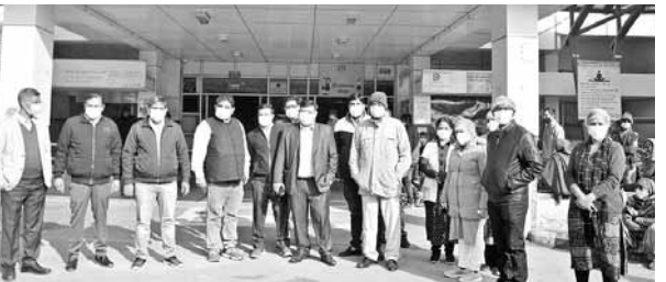
ओपीडी के बाहर खड़े हड़ताल में शामिल चिकित्सक।