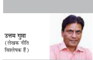
उत्तम गुणा (लेखक नीति विश्लेषक हैं)

उचित रास्ता भारतीय आनलाइन खुदरा व्यापार में प्रत्यक्ष विदेशी निवेश को वैध बनाना आफ्लाइन खुदरा व्यापार में बिना शर्त 100 प्रतिशत एफडीआई की अनुमति देना है।