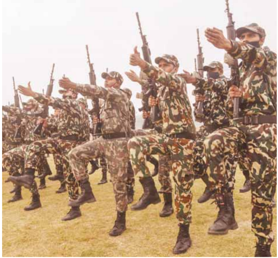
पटना में गणतंत्र दिवस परेड की तैयारी करते हुए जवान।