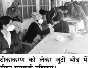
टीकाकरण को लेकर जुटी भीड़ में टीका लगवाती महिलाएं। जिले में 18 साल से अधिक उम्र के 15 लाख 81 हजार 411 लोगों को टीके लगाए जा चुके हैं। लेकिन आंकड़ा दौंगने से परा हो चुका है। मंगलवार को भी 18842 को लगाई गई। जिसमें बुस्टर डोज लगवाने वालों में 212 हेत्यू वक्रों और 92 प्रेंट लाईन वक्रों और 60 प्लस आयुवर्ग में 452 बुजुर्ग शामिल थे। वहीं 15 प्लस आयुवर्ग में कुल 5948 किशोरों को डोज लगी।

द्वारा कोरोना बचाव के लिए टीकाकरण अभियान तेजी से चलाया जा रहा है। 18 साल से अधिक उम्र के 89.86 प्रतिशत टीकाकरण पूरा हो चुका है। जिसके तहत मंगलवार को 9640 को डोज लगाई गई। 14 लाख से अधिक लोग टीके की दोनो डोज लगवा चुके हैं। वहीं, 15 से 17 साल तक की उम्र के 49 हजार से अधिक किशोर टीके की पहली डोज ले चुके हैं। जिसमें मंगलवार को 5948 ने प्रथम डोज लगवाई। जिले में टीकाकरण अभियान को शुरू हुए एक साल पूरा होने वाला है और अभी तक यहाँ पर टीके की 33 लाख 77 हजार 119 डोज लगाई जा चुकी हैं। शुरुआती टारगेट के अनुसार