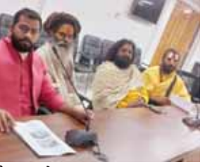
बैठक करते संत महात्मा।

खाक चौक व्यवस्था समिति का माघ मेले में जमीन और सुविधा आवंटन को लेकर विवाद दिनों दिन बढ़ता जा रहा है। जहां एक तरफ दर्जनभर संत महात्माओं ने मनमानी जमीन और सुविधाओं को ले लिया है वहीं चार दर्जन से ज्यादा संत महात्मा बिना जमीन और सुविधा के सड़क पर हैं। वह लोग बार बार माघ मेला प्रशासन कार्यलय का चक्कर लगा रहे हैं। जिससे वह परेशान होकर महीनों से माघ मेला कार्यालय का चक्कर लगा रहे हैं। जब तक समस्याओं का समाधान नहीं होगा उन लोगों का धरना प्रदर्शन और अनशन माघ मेला कार्यालय पर जारी रहेगा।