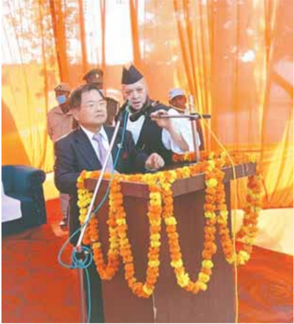
कार्यक्रम में संबोधित करते जापान के पूर्व मंत्री