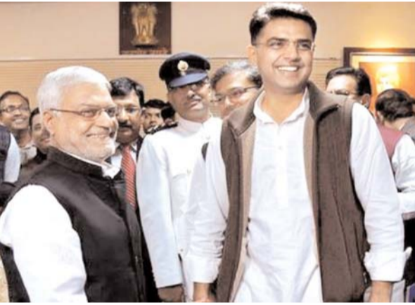
फैसले से सचिन पायलट को राहत।

सुनवाई के दौरान स्पीकर के वकील कपिल सिब्बल ने कहा है कि इस स्टेज पर प्रोटोकॉल ऑर्डर नहीं दिया जा सकता। हाईकोर्ट ने नोटिस का जवाब देने के लिए समय बढ़ा दिया और कहा कि कोई कार्रवाई नहीं