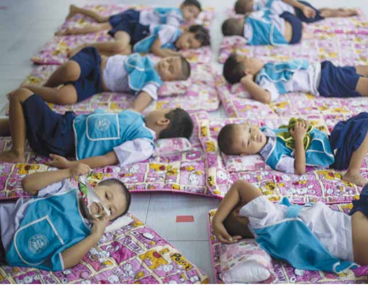
बैकोंक के नकासन प्रीस्कूल में गोजन के बाद एक नियमित रूप से आराम करते बच्चे। गौरतलब है कि स्कूलों को फिर से खोल दिया गया है जो मार्च के मध्य से बंद थे

मैदुगुड़ी। इस्लामिक चरमपंथियों ने पिछले महीने पूर्वोत्तर नाइजीरिया से अगवा किए गए पांच सहायता कर्मियों की हत्या का एक वीडियो जारी किया है। इन सहायताकर्मियों का अपहरण उस वक्त हुआ था जब वोको हराम से अलग होकर बने एक समूह ने अंतरराष्ट्रीय सहायता समूहों और सेना की मदद करने वाले नाइजीरियाई लोगों को निशाना बनाने की चेतावनी दी थी। नाइजीरिया के राष्ट्रपति मुहम्मद बुहारी ने एक बयान जारी कर मुक्तकों की पहचान देश के स्टेट इमरजेंसी मैनेजमेंट एजेंसी, इंटरनेशनल चैरिटीज एक्शन एंजिस्ट हेमर, रिच इंटरनेशनल एंड इंटरनेशनल रेस्क्यू कमेटी के सदस्यों के तौर पर की है। बुहारी ने संकल्प किया कि उनकी सरकार दौधियों को न्याय के दायरे में लाने के लिए हर संभव प्रयास करेगी। संयुक्त राष्ट्र ने कहा कि सहायता कर्मी जब मोनुगुनी और राजधानी मैदुगुड़ी के बीच एक मुख्य सड़क से गुजर रहे थे तभी उनका अपहरण किया गया था।