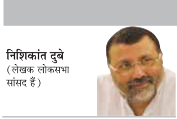
निशिकान्त दुबे (लेखक लोकसभा सांसद हैं)

बलूचिस्तान की रणनीतिक स्थिति को देखते हुए भारत को बलूच आंदोलन का समर्थन कर इसे आजाद होने में सहायता करनी चाहिए। यह पाकिस्तान व चीन के खिलाफ भारत को महत्वपूर्ण रूप से शक्तिशाली बनाएगा।