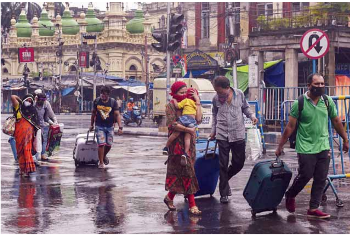
कोलकाता में कोरोना वायरस बीमारी पर अंकुश लगाने के लिए जारी लॉकडाउन के बीच सड़क पर चलते यात्री