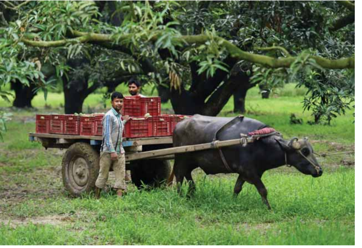
बुलंदाहर में गुठवार को एक आम के बाग में गैस गाड़ी से आम बोते मजदूर

देश में अभी तक कोविड-19 की 1.5 करोड़ से अधिक जांच हो चुकी है। भारतीय आयुर्विज्ञान अनुसंधान परिषद (आईसीएमआर) के अनुसार 22 जुलाई तक देश में 1,50,75,369 नमूनों की जांच की गई है, जिनमें से 3,50,823 नमूनों की जांच बुधवार को ही की गई। कोविड-19 से अभी तक 29,861 मरीजों की मौत के मामलों में महाराष्ट्र में सबसे अधिक 12,556 लोगों ने जान गंवाई है। इसके बाद दिल्ली में 3,719 तमिलनाडु में 3,144, गुजरात में 2,224, कर्नाटक में 1,519, उत्तर प्रदेश में 1,263, पश्चिम बंगाल में 1,221, आंध्र प्रदेश में 823, मध्य प्रदेश में 770, राजस्थान में 583 और तेलंगाना में 372 लोगों की मौत हुई।